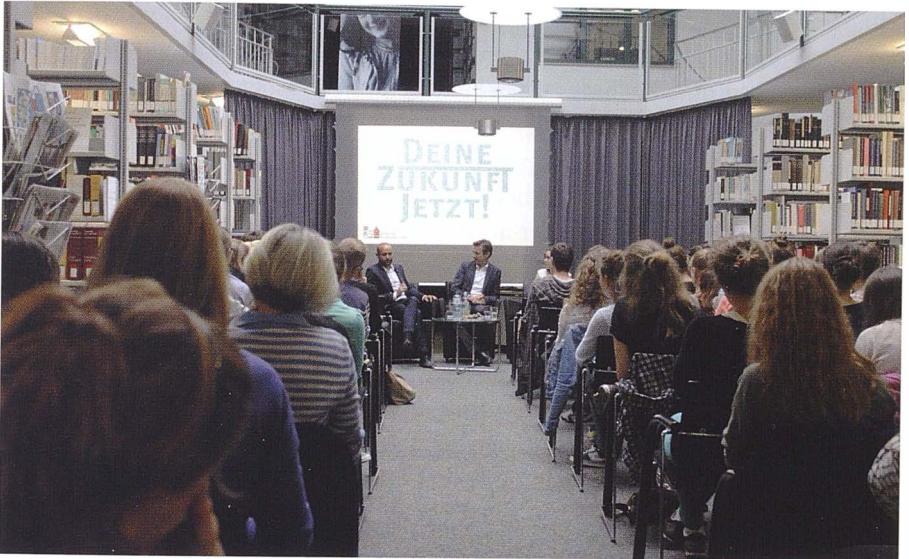
Absolventengespräche im Juli 2014 und im Juli 2015