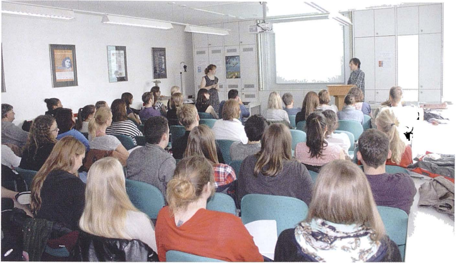
Eindrücke von den Praktikumsworkshops am ZNS

Die Praktikumsreflexion wird am ZNS auch vor dem Hintergrund, dass Studierende von den Erfahrungen ihrer Kommilitonen lernen sollen, für besonders wichtig erachtet. Sie findet anschließend an das Praktikum zum einen in Form eines Praktikumsberichts, zum anderen in Form eines Praktikumsworkshops statt. Im Workshop stellen die Studierenden ihren jeweiligen Einsatzort zunächst vor, dann beschreiben sie ihre Tätigkeiten. Anschließend erfolgt die Reflexion bezüglich der Verbindung zwischen Studium und Beruf sowie der eigenen Leistungen und Fortschritte. Zu den Workshops sind neben den Studierenden des jeweiligen Studienjahres stets auch die jüngeren Jahrgänge eingeladen, sodass diese Eindrücke und Ideen gewinnen können. Um diesen Austausch zu fördern, stellen die Studierenden ihr Praktikum auch im Rahmen einer Posterausstellung vor.