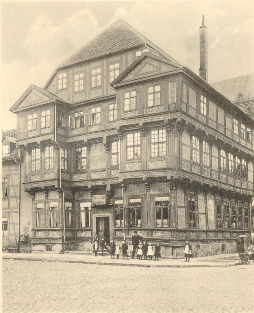
Hildesheim. Fig. 80. Neustädter Schenke. 1550 u. 1601.