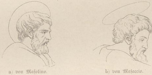
Fig. 120. Köpfe aus den Wandgemälden der Brancaccikapelle im Carmine zu Florenz.

gemälde? Die neuere Kritik schwankt zwischen beiden Meinungen, wie sie auch die Fresken in S. Clemente in Rom, welche an der Wölbung die Gestalten der Evangelisten und Kirchenväter, an den Wänden u. a. die Legende des h. Ambrosius, der h. Katharina und die Kreuzigung (Fig. 115) schildern, bald dem einen, bald dem anderen Maler zuschreibt. Die Meinung, daß der Meister der Fresken von Castiglione auch in S. Clemente gemalt hat, verdient unbedingt den Vorzug; die Arbeiten in S. Clemente müssen danach erst in den letzten Lebensjahren Majolinos (1446—1450) entstanden sein. Aber auch wenn wir vor die Entscheidung gestellt werden, ob zwischen den Bildern in der Brancaccikapelle ein bloßer Grad- oder ein wirklicher Grundunterschied walte, ob die drei frühesten Wandgemälde daselbst (Sündenfall, Auferweckung der Tabitha und Predigt Petri) die Hand des noch nicht gereiften Schülers oder jene des noch auf einer niedrigeren Stufe stehenden Lehrers verraten, so spricht manches zu gunsten Majolinos. Nach verschiedenen Modellen sind Adam und Eva im Sündenfall (Fig. 116) und in der Vertreibung (Fig. 117) entworfen. Sie stimmen weder in den Umrissen noch in den Maßen überein. Die fremdartigen Trachten in der Auferweckung der Tabitha (Fig. 118) kehren in Castiglione d'Ona (Fig. 114 u. 119) wieder. Auch die Heiligenscheine (Fig. 120) zeigen in den drei früheren Bildern eine andere Gestalt, als in den Gemälden,