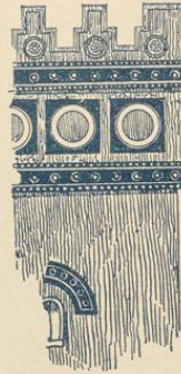
Fig. 14 und 15. Assyrien. 14: Bogen von einem Palast zu Khorsabad. 15: Teil der Restauration eines Hauptgesimses in Khorsabad (nach Place).

Säulenordnung bekannt. Als ihre Hauptvertreterin gilt die Grabfäçade von Beni Hassan. Fig. 10b (oder Fig. 58, Band II).