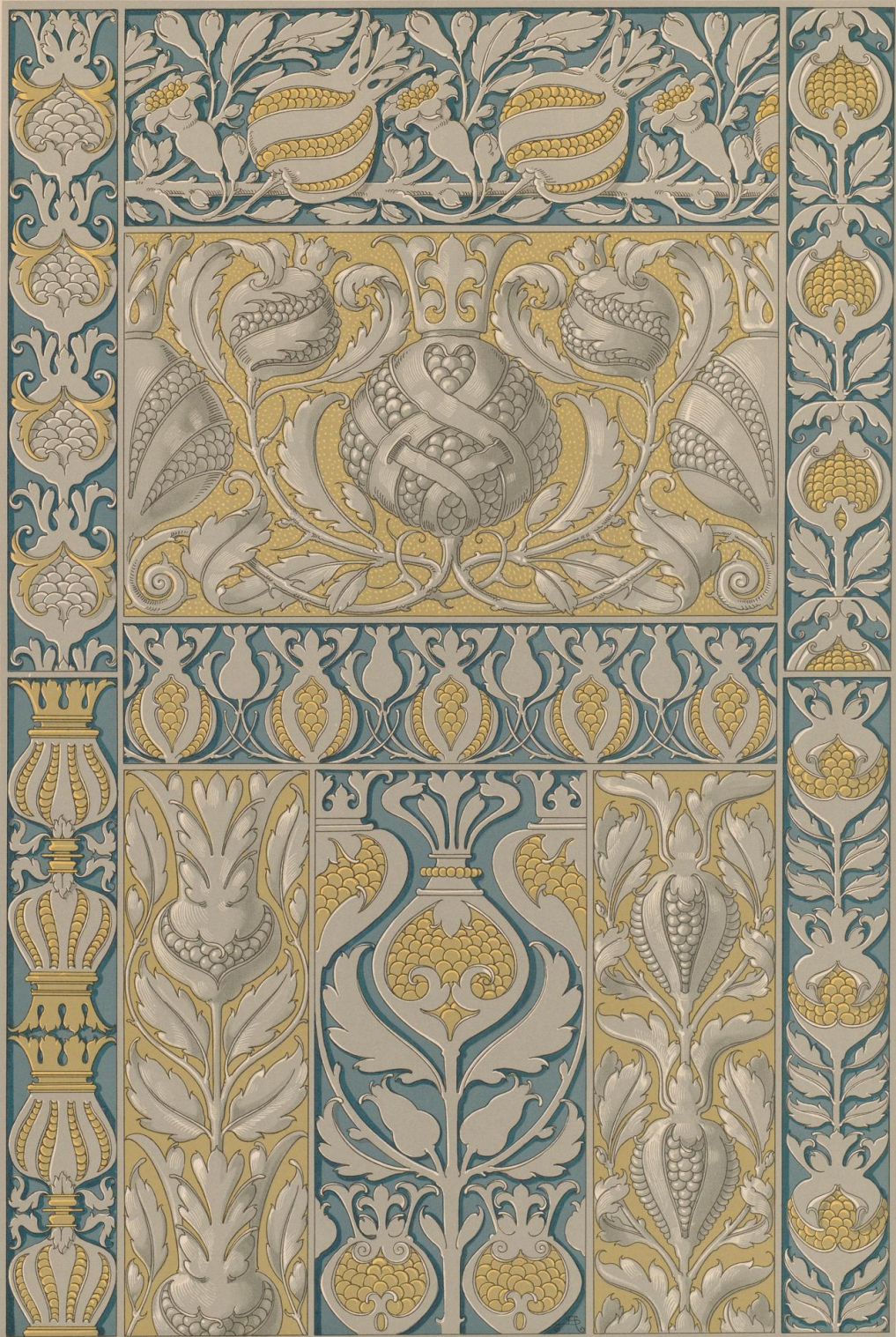
Lab. E. 70. A. Druck- und Verlagsanstalt „Die Kunst“