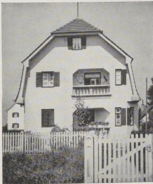
Giebelansicht eines Hauses mit vorgeblendeter Mansarde

Man hört vielfach, ein Mansarddach sei billiger als ein massives Obergeschoß, weil ja lediglich das Dach ausgebaut werden müsse. Das ist aber keineswegs richtig. Ein Mansarddachstuhl ist viel komplizierter und daher teurer als ein normaler Dachstuhl. Was nun den Ausbau anbelangt, so kann man freilich an Stelle von 38 cm oder 25 cm starken Außenwänden mit schwachen Leichtsteinwänden als äußeren Zimmereinfassungen auskommen; auch der Außenputz kommt in Wegfall. Dafür muß man aber dort Dachflächen anbringen, wo man eigentlich keine brauchen würde, so daß von einer Kostenersparnis keine Rede sein kann, wenigstens nicht bei einwandfreier, solider Ausführung, die doch bei einem Neubau die Regel sein sollte. Noch ungünstiger gestaltet sich der Vergleich zwischen Mansarddach und Vollgeschoß, wenn man die später auftretenden Unterhaltungskosten in Betracht zieht. Es ist eine alte Erfahrung, daß am Dach und an den Dachanschlüssen am ersten und häufigsten Reparaturen notwendig werden. Deshalb ist es doch eigentlich widersinnig, die Dachfläche künstlich zu vergrößern oder eine Dachhaut dort anzubringen, wo man auch ohne eine solche auskommen kann.