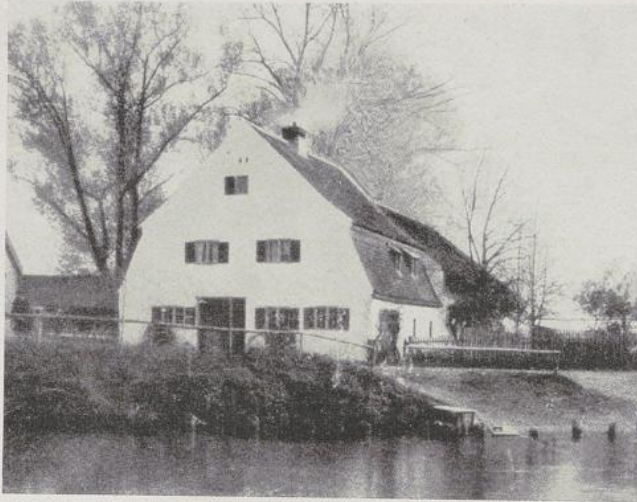
Altes Giebelhaus mit Mansarddach in Unterbruck an der Amper (Abb.)

Auf diesem Bild ist besonders gut zu erkennen, worauf es bei der richtigen Gestaltung eines Mansarddaches vor allem ankommt: Das Hauptgesims springt nur wenige Zentimeter über die Hausumfassungen vor, der untere Teil des Mansarddaches ist stark zurückgeneigt, der nutzbare Raum innerhalb der Mansarde ist infolgedessen kleiner als im Erdgeschoß. Kein Giebelvorsprung