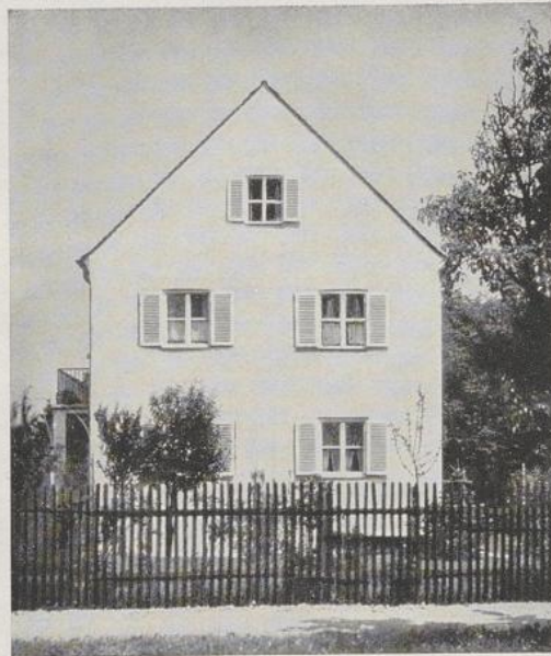
Giebelansicht eines Hauses mit massivem Obergeschoß

Die Außenwände sitzen im Erd- und Obergeschoß in gleicher Flucht, die Mansarde ist nur vorgehängt. Ausnehmend häßlich ist hier der Dachvorsprung mit Knotenbildung an den Bruchpunkten. Durch die Loggien ist die Hauswand auf ein Drittel ihrer Breite aufgerissen.