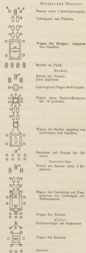
Fig. 417. Bruchstück aus der Festzugs-Grundrissrolle. Karlsruhe 1896.

Zug überraschend pünktlich ein. Es war alles wohl geordnet. Die Aufstellung hatte nur zwei Unfälle zu verzeichnen. Ein geharnischter Reiter hatte sich von seinem Pferd getrennt und musste auf die Teilnehmer-schaft verzichten; ein defekt gewordener Wagen musste ausgebessert werden. Genau um 11 Uhr 30, gerade als alles in Ordnung war, setzte sich der Zug in Bewegung. Auf dem Schlossplatz angelangt, musste der Zug einige Minuten warten, bis die um 12 Uhr anlangende Kaiserin ins Schloss gefahren war. Um 1 Uhr 15 hatte das Ende des Zuges das Schloss passiert. Um 2 Uhr war der Zug bereits aufgelöst.