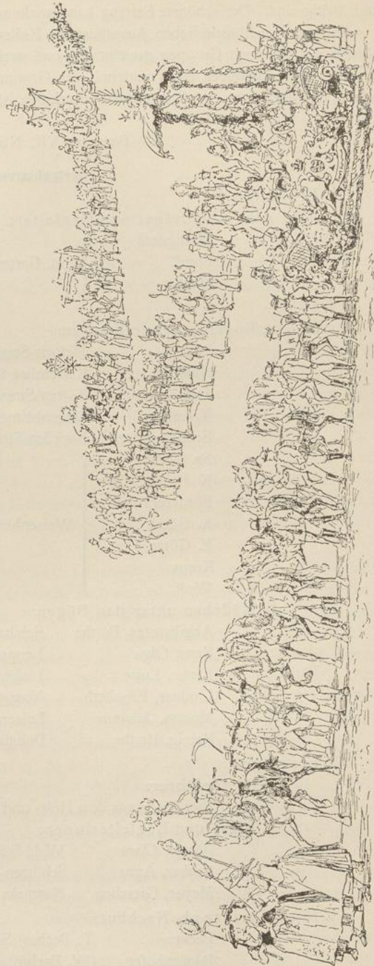
Fig. 415. Partie aus dem Festzug der Wetinfier. Dresden 1889. (Albmann, Festschrift.)

Der Finanzausschuss hat zu beraten über die Aufbringung der Geldmittel, über die Vorschläge und die Abrechnung. Der Pressausschuss besorgt die Reklame, die Programme und Festschriften, überhaupt, was mit Druck und Publikation zusammenhängt. Der künstlerische Ausschuss kommt für die Skizzen und Festzugsbilder auf; er kostümiert die Teilnehmer; er entwirft, leitet und überwacht die Dekorationen, baut die Wagen etc. Der Festordnungsausschuss bestimmt im Einvernehmen mit dem künstlerischen Ausschuss die Reihenfolge des Zuges und den Weg, den er zu nehmen hat; er geht die Strassen ab und beseitigt etwaige Hindernisse, wie Telephon- und Telegraphendrähte; er hält Reit- und Fahrproben ab, giebt den Zugführern die erforderlichen Anweisungen, sorgt für die Strassensperrung und für Passierscheine, leitet die Aufstellung und Auflösung des Zuges etc.