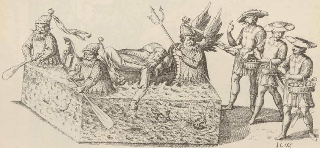
Fig. 404. Festwagen mit Gondel. Stuttgart 1617.

Die Figur 401 und 402 bringen zwei Schlitten aus einem Maskenzuge zu Stuttgart unter Herzog Johann Friedrich von Württemberg. Nach Math. Merian 1617.