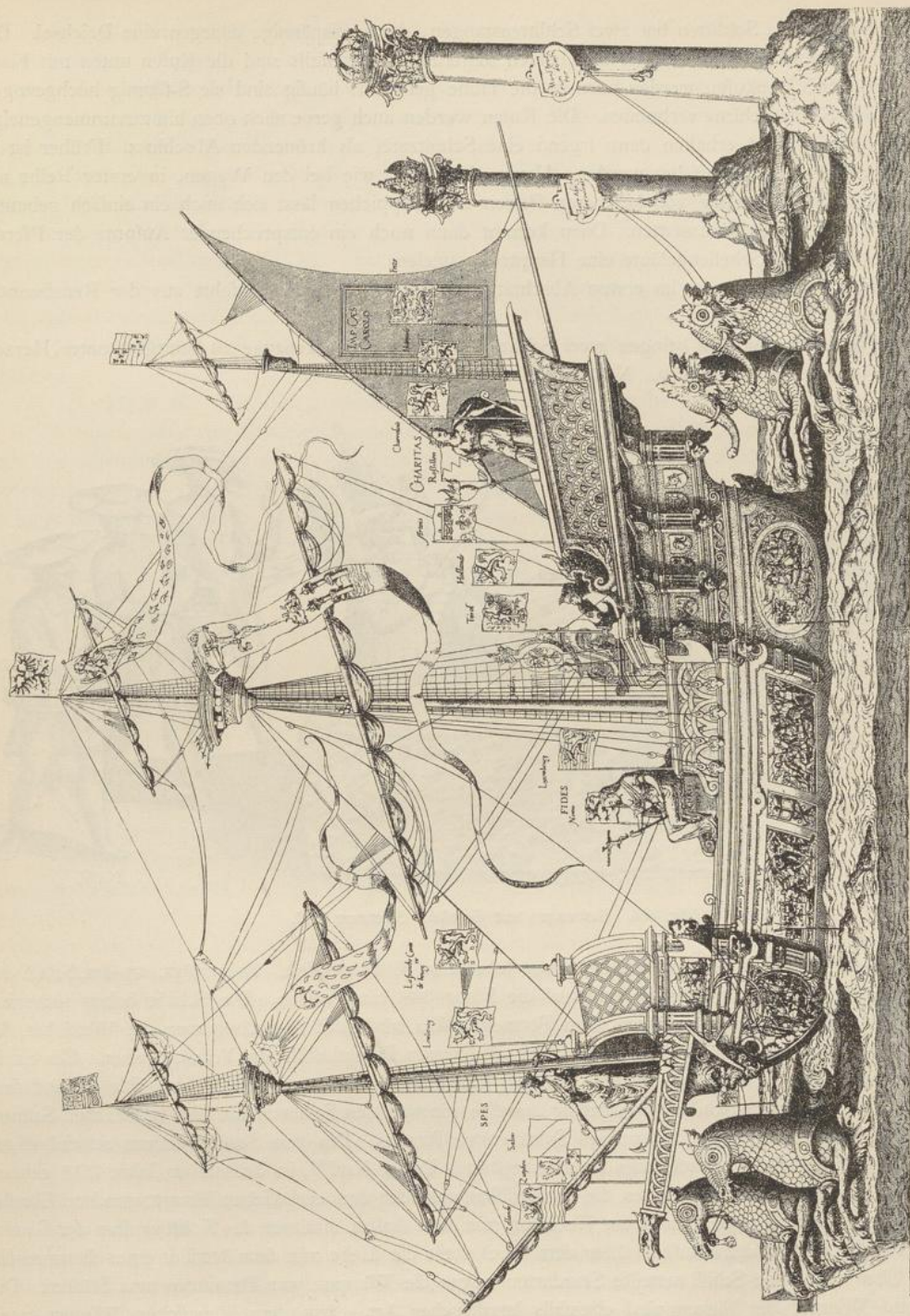
Fig. 403. Carrus navalis. Totenfeier Kaiser Karl V. Brüssel 1568.