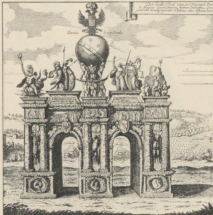
Fig. 127. Rückseite zu Figur 126.

h. Von den Festhallen können hier diejenigen ausser Betracht bleiben, welche als bleibende Bauten erstellt werden. Die letzteren entstehen allerdings nicht selten auf Grund eines bestimmten Festes, wie bei-