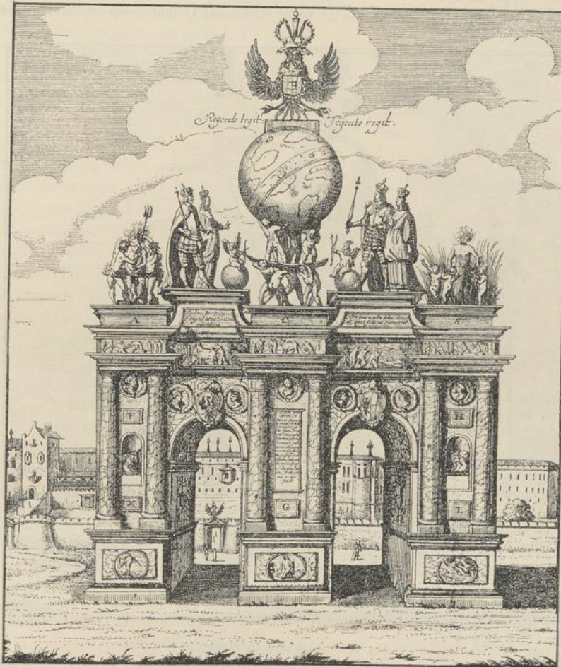
Fig. 126. Triumphbogen aus Trient. Um 1600. Vorderseite.

Mainz im Jahre 1894 errichtet. Die Lichtweite des Haupteingangs betrug etwa 9 m, diejenige der Seiteneingänge 2,3 m. Das Ganze war als nachgeahmte Steinarchitektur in verschaltem Holzfachwerk aufgeführt. Die Figur 124 verzeichnet das Hauptportal des 7. deutschen Bundesschiessens in München 1881. Das nach den Plänen von Rud. Seitz und Gabr. Seidl von Zimmermeister Bleibinhaus errichtete Bauwerk war neben seiner dekorativen Bedeutung auch praktisch vielseitig. Es enthielt die Geschäftsräume verschiedener Ausschüsse, eine Zeitungsverkaufsstelle, das Spritzenhaus, die Feuer- und Nachtwache.