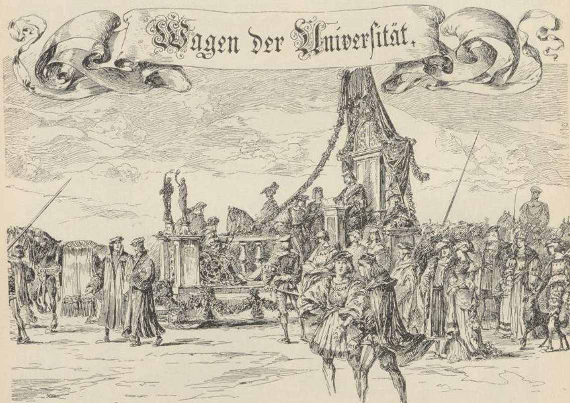
Fig. 68. Vom Festzug des Heidelberger Universitäts-Jubiläums 1886. (Aus der Ruperto-Carola, illustrierte Festchronik der 5. Säcularfeier der Universität Heidelberg.)

Korbflückern der Gersauer Kirchweih. Die Darbietungen der Gruppen nahmen vier Stunden in Anspruch. Schliesslich sammelten sich sämtliche Trachtenträger zu einem Ganzen. Aus der Alpenhütte trat die hehre Gestalt der Helvetia, und vor ihr defilierte der Zug, nach Kantonen geordnet. Ein vaterländisches Lied schloss den offiziellen Teil; das Tanzvergnügen und die allgemeine Fröhlichkeit trat in ihre Rechte. Nun konnten die Städter, die sich an den Gruppenbildern erfreut hatten, die originellen und zum Teil auch prächtigen Trachten im einzelnen studieren und die Hauben mit den Stickereien, die Hüte mit den Alpen-