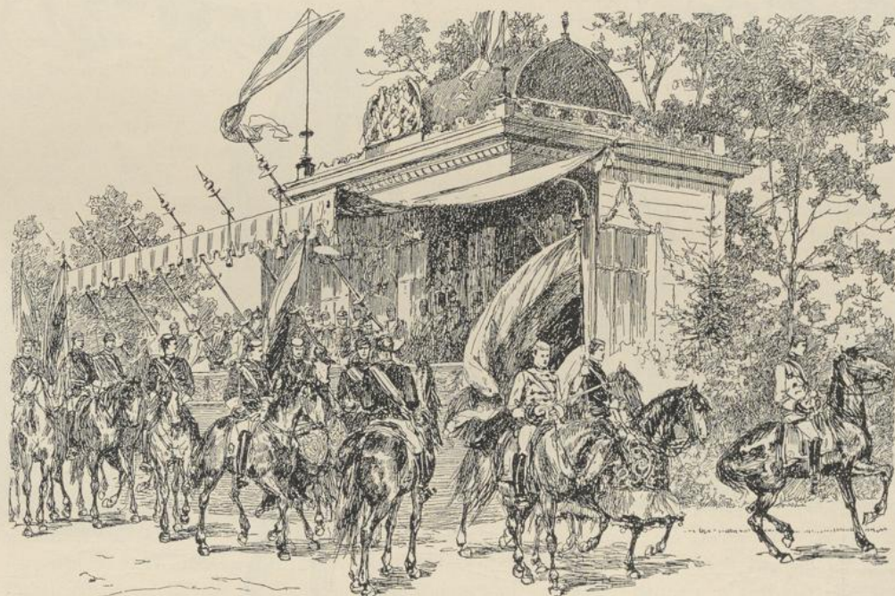
Fig. 67. Fürstenpavillon. Heidelberger Universitäts-Jubiläum 1886. (Aus der Ruperto-Carola, illustrierte Festchronik der 5. Säcularfeier der Universität Heidelberg.)

In Zürich hat man Sinn und Verständnis für Kostümfeste; man ist daran gewöhnt. Der Züricher Karneval ist das alljährliche Frühlingsfest des Sechseläutens. Seltsam gekleidete Kinder ziehen mit Kränzen und buntgeschmückten Bäumchen von Haus zu Haus. Sie führen auf einem Wagen eine Stroh- puppe, die, an eine lange Stange gesteckt, auf einem Scheiterhaufen von zusammengebetteltem Holz und Reisig verbrannt wird, sobald um 6 Uhr die Abendglocke ertönt, die Winters über nicht geläutet wird. Während der Winter verbrannt wird und bis tief in die Nacht hinein knallt es aus Hunderten von Büchsen und Böllern; Raketen, Feuerräder und bengalische Flammen werden abgebrannt. Die Zünfte und andere Genossenschaften feiern den Tag durch Festessen, denen sich ein kostümierter Zug anzureihen pflegt. Bei den Gelagen des Abends macht man sich gegenseitig Gesellschaftsbesuche; mit Musik und bunten Laternen geht es herüber und hinüber; auf den Strassen und in den Gässchen entwickelt sich ein buntes, heiteres Bild.