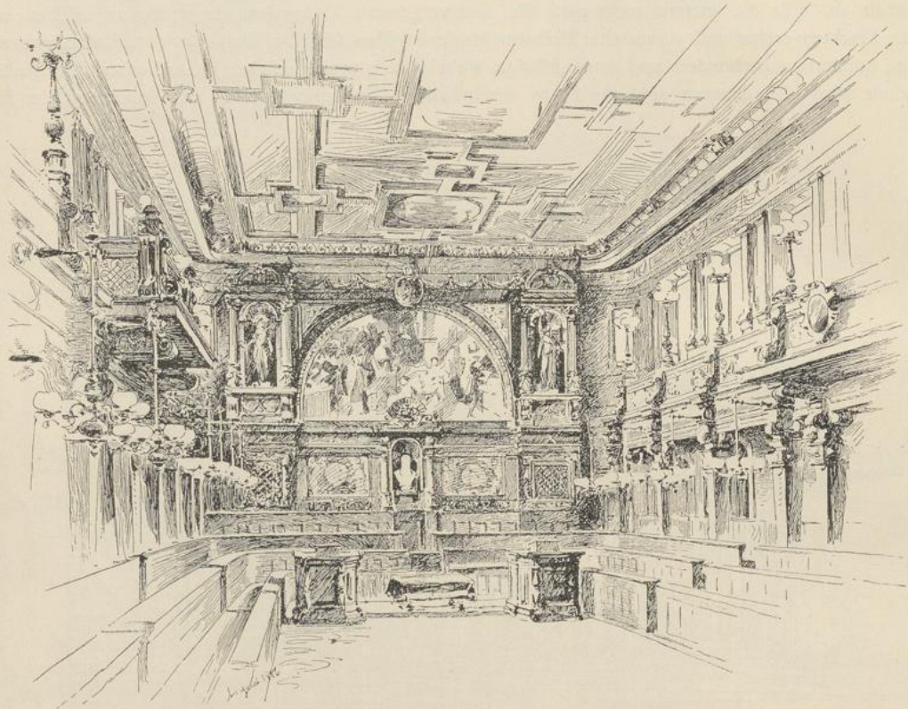
Fig. 65. Aula der Universität Heidelberg.

Es wäre wohl besser, wenn weniger Feste gefeiert würden, diese aber unter einer allgemeinen Beteiligung. Es wäre auch besser, wenn die „bessere“ Gesellschaft durch ihre Anwesenheit dem Unfug und der Verwilderung vorbeugen wollte, anstatt die letztern als Grund zu nehmen, um wegzubleiben. Wer sich dem Volke nur dann nähert, wenn er etwas von ihm haben will, der wird wenig erreichen. Feste, die bloss deshalb gefeiert werden, um den Teilnehmern zu Räuschen und den Wirten zu vollen Taschen zu verhelfen, haben entschieden ihren Beruf verfehlt.