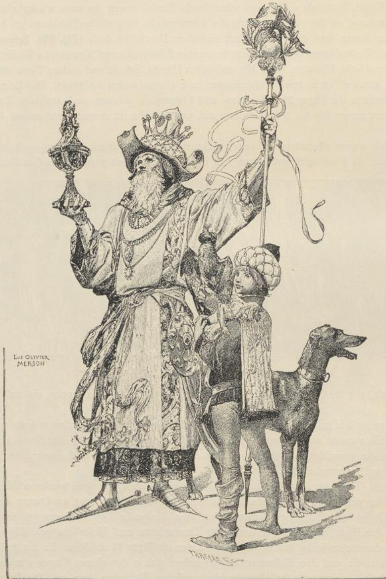
Fig. 30. Mysterienspieler.

Das einfache, gläubige Volk, dem die Mysterien ans Herz gewachsen waren, hat ihre Entartung wohl nicht weniger bedauert als der Klerus, welcher sich von ihnen zurückzog. Dieses Volk hat sich da