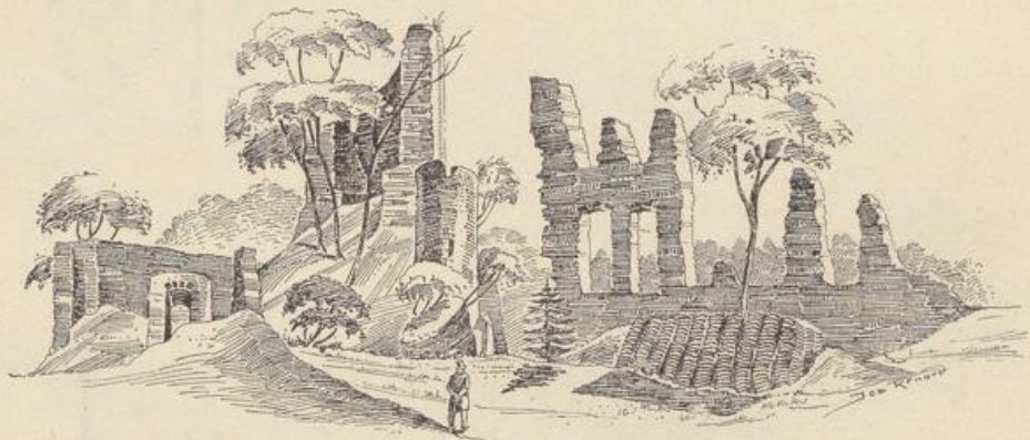
Fig. 52. Burg Windeck. Ansicht.

Felsspitze noch ein kleines Treppentürmchen, das wahrscheinlich den hier gelegenen Thorbau mit dem Plateau des Bergfrids verband. Der grössere Teil der Ostseite wird durch die in einer Länge von sechs Fensterachsen noch erhaltene Aussenmauer des Palas aus dem 15. Jh. eingenommen (Fig. 52); die Mauer ist zum Teil noch bis zur Höhe des zweiten Geschosses erhalten.