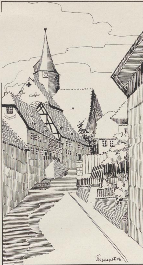
Abb. 52. Stellung betonter Bauten in steilen Straßen (Nordhausen, Frauenberg).

Für die Herstellung der Straßendecke ist das Steigungsverhältnis einer Straße nicht ohne Bedeutung. Von den sogenannten geräuschlosen Pflastern ist Holzpflaster nur bis zu einer Steigung von 1:40, Stampfasphalt sogar nur bis zur Steigung 1:70 ausführbar 1) . Allerdings wird die technische Nichtausführbarkeit bei steileren Steigungen kaum vermißt werden. Denn je steiler eine Straße ist, um so gröber und ungleicher muß das Pflaster sein. Man ist in den steilen Gassen alter Städte oft erstaunt über das »schlechte« Pflaster. Aber gleichmäßiges, glattes Pflaster wäre dort gar nicht verwendbar. Das Pflaster ist einfach aus der Notwendigkeit heraus entstanden, den Pferden durch rundköpfige Steine einen möglichst Anhalt zu gewähren 2) . Steigungen von 1:12 bis 1:8, wie sie sich tatsächlich in alten deutschen Städten oft finden, sind gar nicht befahrbar, wollte man sie asphaltieren oder mit großen, platten Steinen pflastern. Je kleiner die Steine, und je mehr