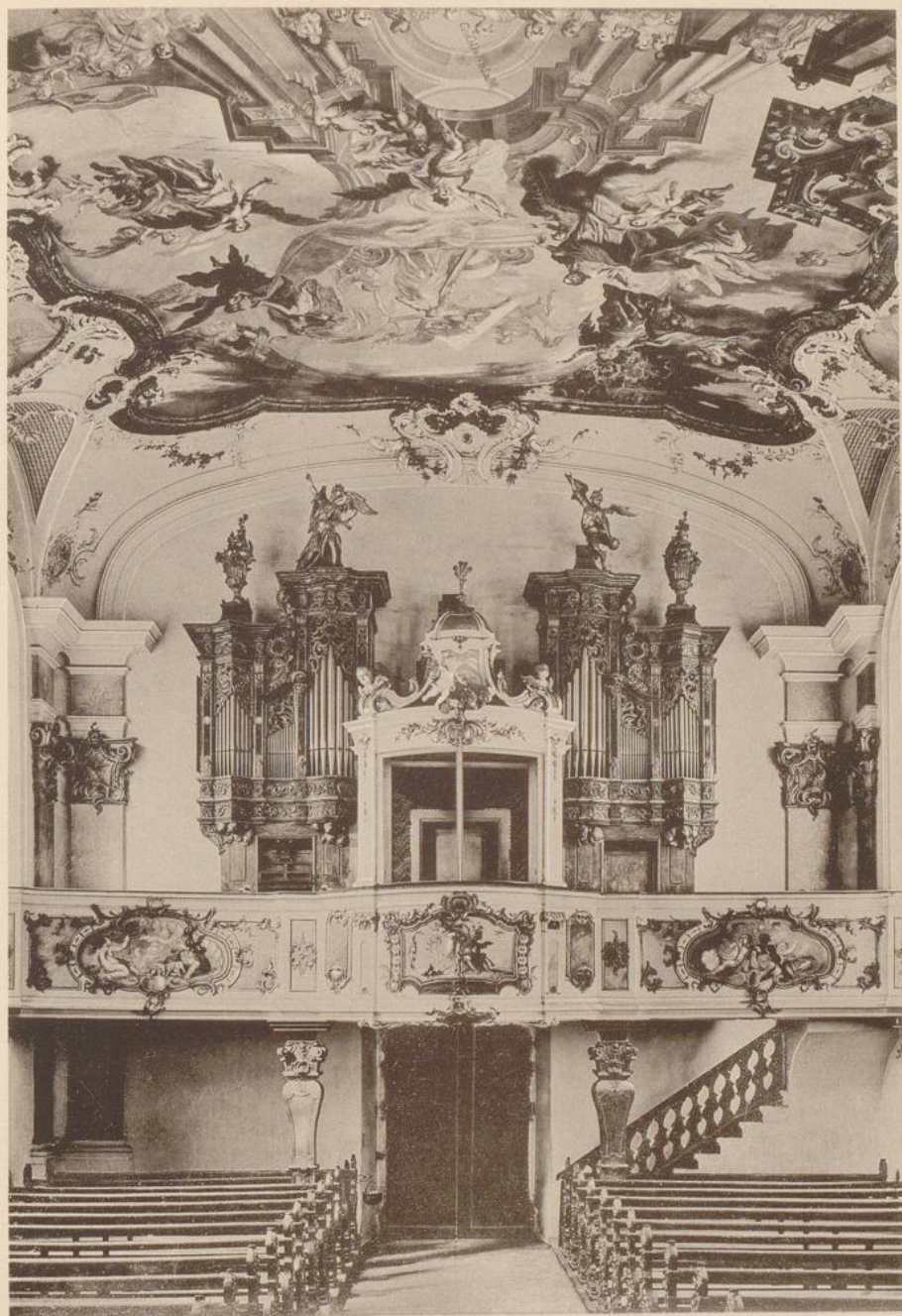
Haigerloch, St. Annakirche. Zu Seite 96.