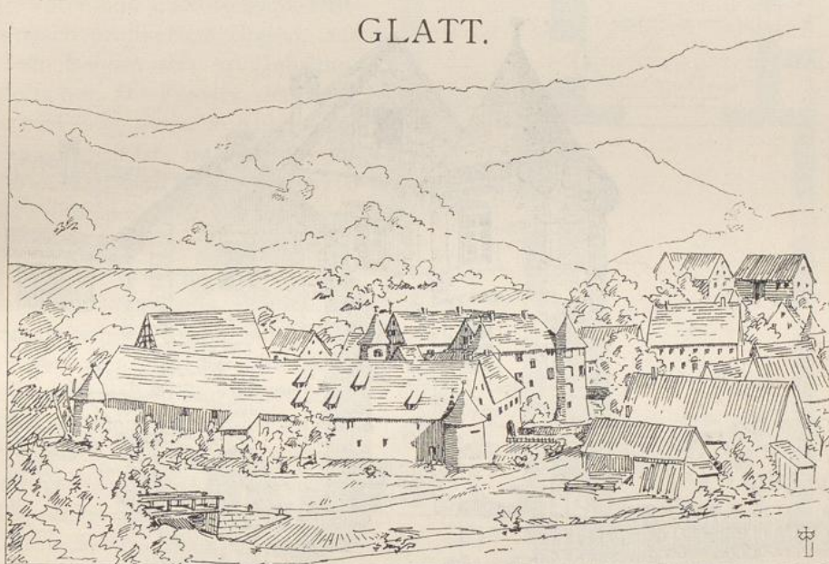
Ansicht von Glatt.

P farrdorf, 85,5 km nordwestlich von Sigmaringen und 33,4 km westlich von Hechingen, liegt in einem engen, vom Glattbach durchströmten und von hohen bewaldeten Bergen umgebenen Thale, das sich schmal von Osten nach Westen öffnet. Nach Osten zu stösst das Glattthal fast senkrecht auf das von Süden nach Norden sich ziehende Neckarthal, von dem der Ort etwa 3 km entfernt ist. Das Wort Glatt hält Buck für vordeutsch, keltisch und leitet es von clot ab, das lauter, glänzend, glatt bedeutet. Die jetzige Form ist aber auch auf glataha (glat hell, glänzend, also dieselbe Bedeutung wie im keltischen Stamm und aha Wasser), glatta , der hellschimmernde Bach, zurückzuführen. Der Ort ist sehr alt und kommt schon 767 als Glada im Besitz des Klosters Lorsch vor. Später,