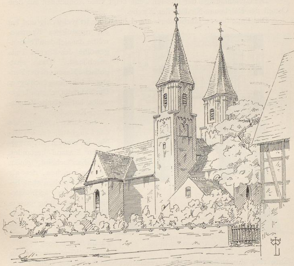
Veringendorf. Ansicht der Pfarrkirche.

allerdings sehr bescheidenen Abmessungen. Das Chor ist mit einem Tonnengewölbe überspannt und hatte einen halbrunden Apsidenabschluss, dessen Fundamente bei der Restauration im Jahre 1887 aufgedeckt wurden. Die kräftigen halbrunden Wandsäulen des Triumphbogens ohne Basen haben derbe Kapitäle mit rechteckiger Platte und Schmiege. Das untere Geschoss der Türme, gegen das Chor geöffnet, ist als Seitenkapelle ausgebildet und hat ausgebaute Apsiden und Kuppelgewölbe; zu beiden