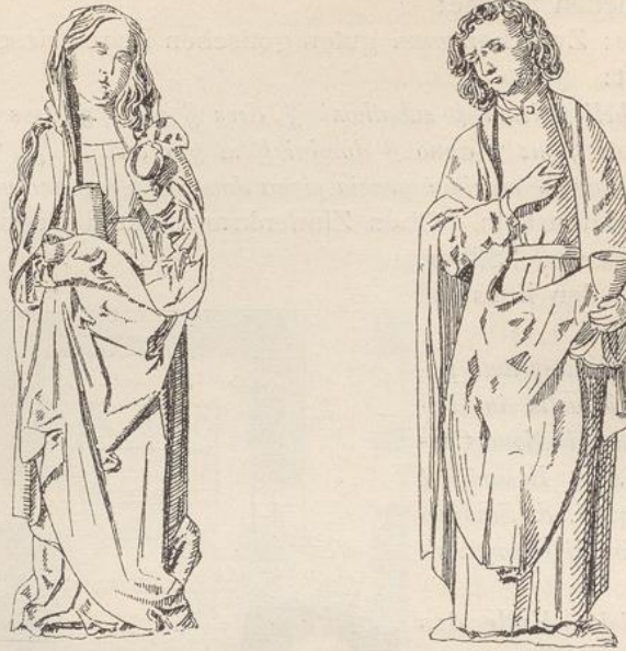
Veringendorf. Holzskulpturen in der Kirche.

An den Pfeilern des Triumphbogens zwei Holzskulpturen: der hl. Johannes und die hl. Magdalena , gute spätgotische Arbeiten.