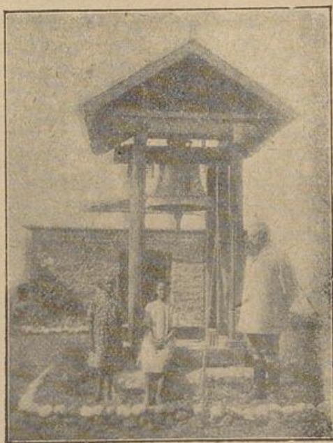
Der Glockenturm in Maria Loreto, (Die Glocke ist über 300 Jahre alt.)