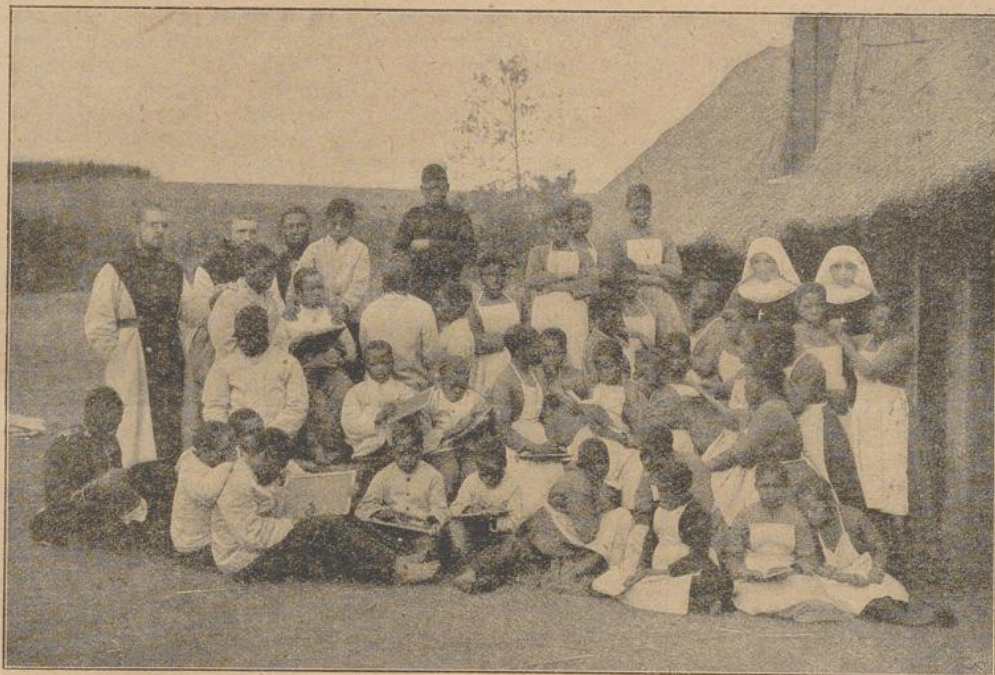
Schule in Mariatrost.

wärts zu bringen. Eine Station vor dem Van Keenens-Paß erhält sie Hilfe. Nochmals werden Wasser und Kohlen eingenommen und hinten schiebt sich eine Lokomotive zum Drücken an. Mit doppelter Kraft geht es jetzt langsam die steile Paßhöhe hinauf. Um die große Steigung zu überwinden, fährt der Zug im Zick-Zack hinauf. Nachdem er eine Strecke zurückgelegt hat, hält der Zug. Jetzt geht's umgekehrt, die hintere Maschine fängt jetzt an zu ziehen, und die bisher vorne war, hilft durch Drücken nach. So geht es einige Male, bis sie endlich keuchend mit ihrer Last oben anlangen; wir haben den Van Keenens-Paß erreicht und befinden uns 5500 Fuß über dem Meere. Oben befindet sich ein Hotel und man hat von hier aus eine herrliche Aussicht auf die Draakensberge. Hier befindet sich auch die Wasserscheide zwischen Natal und Oranje-Freistaat. Zu