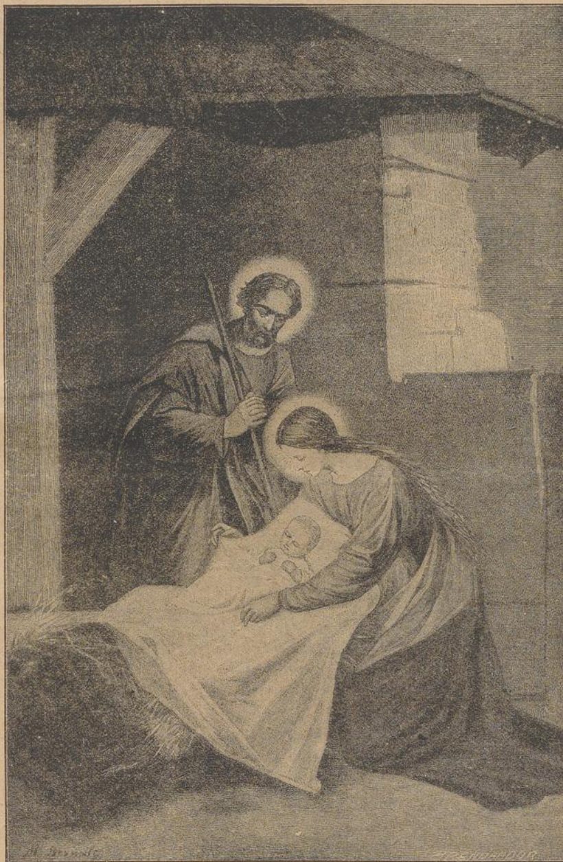
Bernaß: Die heilige Familie.

Tiefeschwärz und schwül war die Nacht; es herrschte eine feierliche, wohlthuende Stille, die nur hier und da durch das leise Schwirren eines Nachtvogels unterbrochen wurde. Als ich am Kloster anlangte, war natürlich alles fest geschlossen und in sanfter Ruhe; doch nach eini-