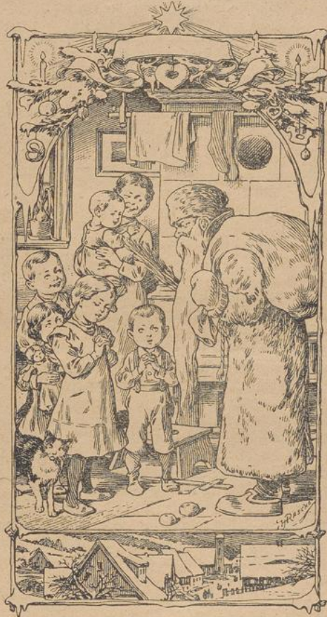
Knecht Ruprecht. Nach einer Zeichnung v. Herrn. Rasche.

Weihnachtsgefänge brachten eine frohe Festesstimmung hervor. Es wäre das gewiß eine der schönsten Freuden für die Freunde und Wohltäter der Mission, wenn sie wie wir, die das besondere Glück haben, direkt in der Mission zu wirken, bei derartigen Gelegenheiten persönlich zugegen sein könnten. Auch die Gläubigen aus der entfernteren Umgebung kamen zahlreich herbei und suchten Herberge für die Nacht, um der Mitternachtsmesse anzuwohnen. Alle Plätze waren belegt und der letzte Winkel wurde noch aufgesucht. Der schöne Gebrauch des gemeinschaftlichen Empfanges der hl. Kommunion am hl. Christtag wird hier getreulich einge-