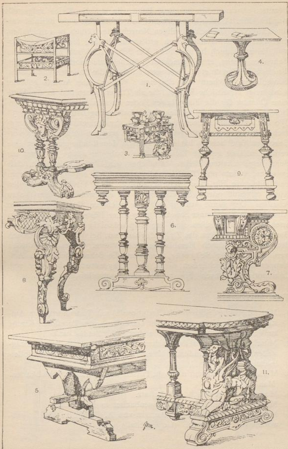
Der gewöhnliche Tisch.