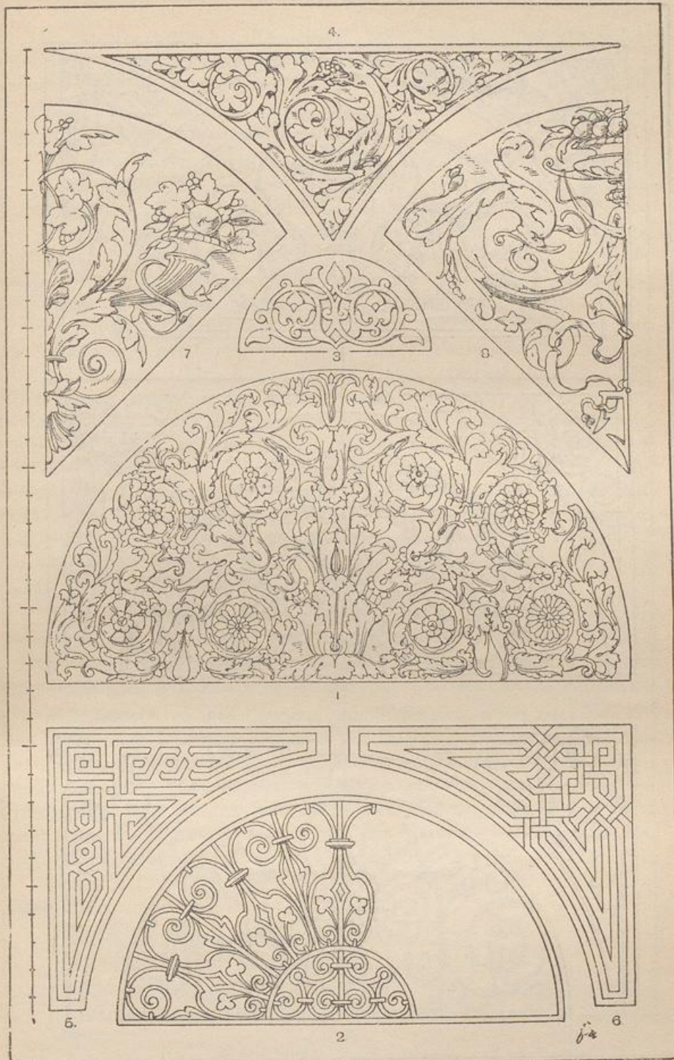
Halbkreis und Zwickel.