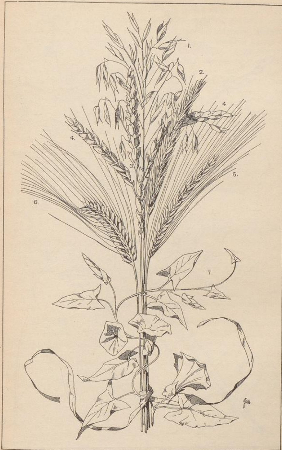
Ähren und Winde.