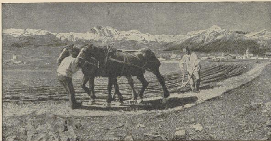
Abb. 43 Pflügen von Giovanni Segantini München, Staatsgalerie