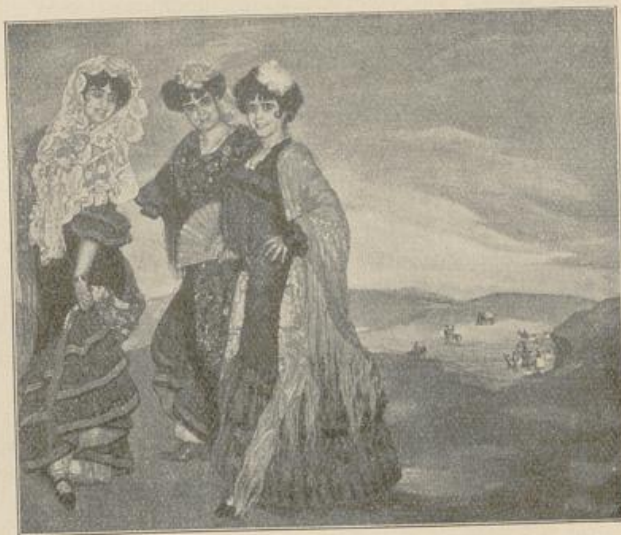
Abb. 44 „Meine drei Cousinen“ von Ignacio Zuloaga (Aus der Münchener „Jugend“)

gebildete, breite große Farbenflächen gegeneinander stellende Ignacio Zuloaga (geb. 1870) genannt. Zuloaga kultiviert einen raffinierten und pikanten, dekadenten und dabei echt spanischen Frauentypus, den er in eckigen und kantigen Silhouetten vor spanisch eintönige, aber großzügige landschaftliche Hintergründe setzt und den er ohne Unterlaß wiederholt, dem er aber auch stets neue verblüffende Wirkungen abzugewinnen versteht (Abb. 44). Welche Gegenstände er auch darzustellen unternimmt, und