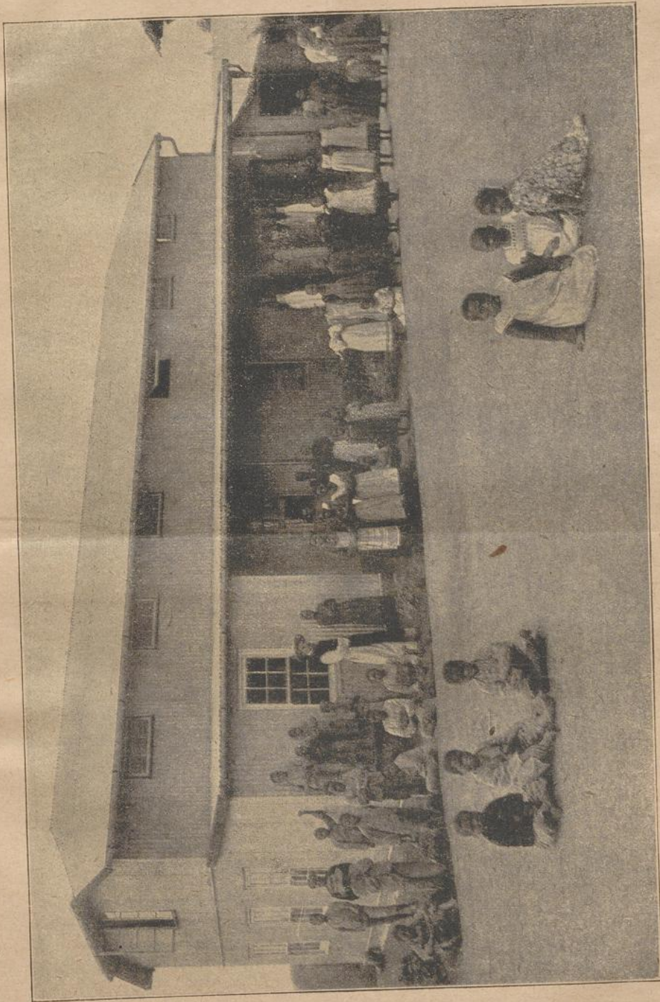
Missionsschule in Himmelberg. (P. Ddo.)

eben noch zu atmen. Es war das eine schwere Heim- suchung Gottes für die beiden Eheleute; aber sie wandelten ihren Kreuzweg gottergeben, ohne Murren und Klagen.