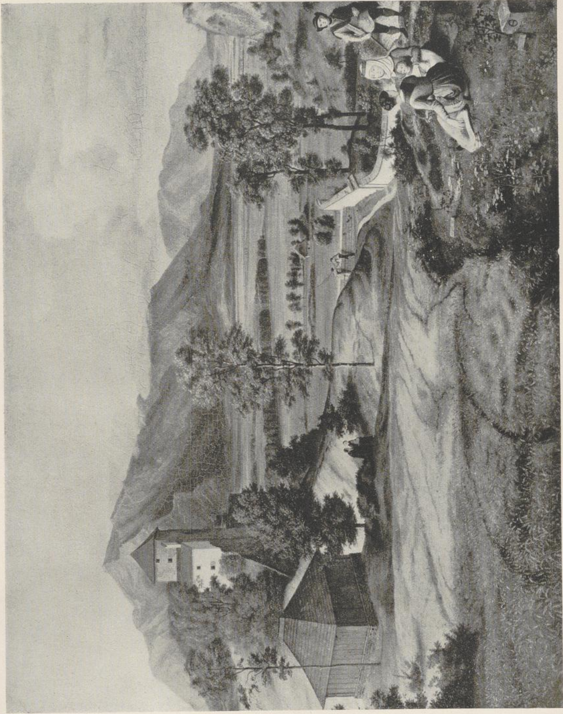
61 Ferdinand Olivier, Landschaft vom Mönchsberg in Salzburg . Um 1826. Dresden, Staatl. Gemäldegalerie