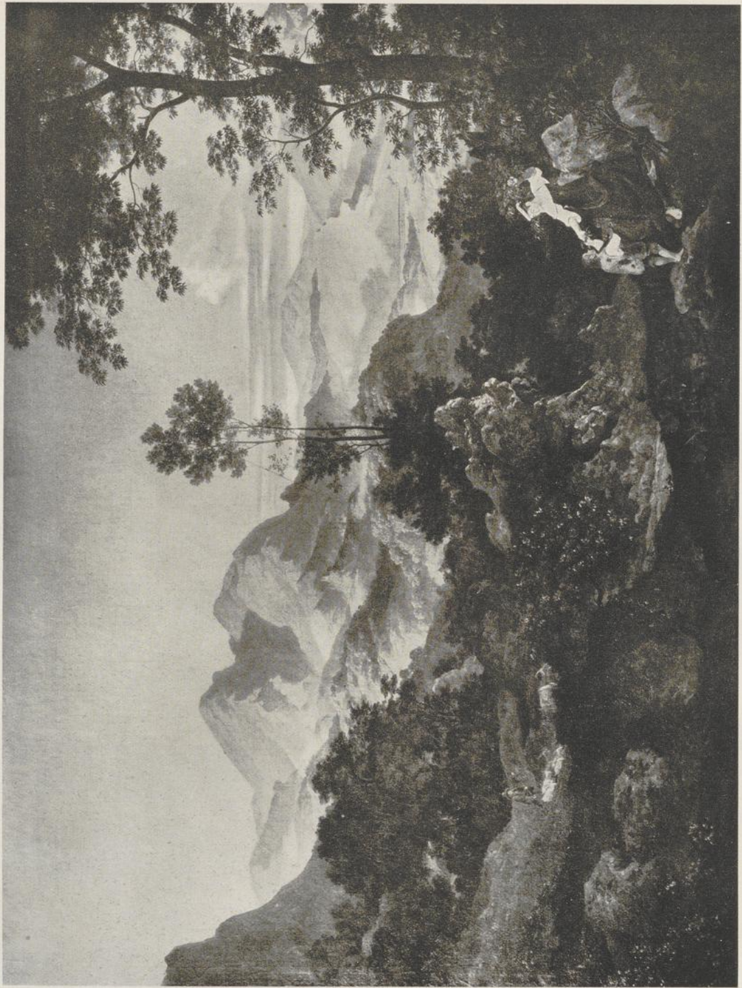
54 Ernst Fries, Römische Gebirgslandschaft. Dresden, Staatl. Gemäldegalerie