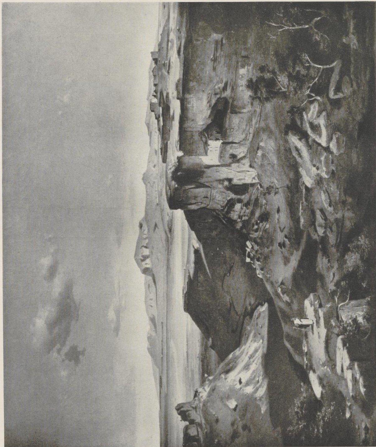
52 Carl Philipp Fohr, Romantische Landschaft in Italien . 1818. Darmstadt, Schloßmuseum