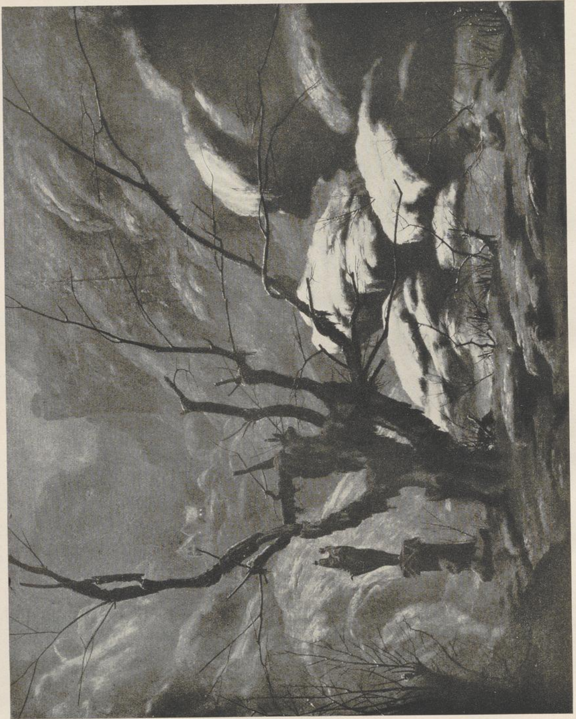
64 Carl Blechen, Gebirgsschlucht im Winter. Berlin, Nationalgalerie