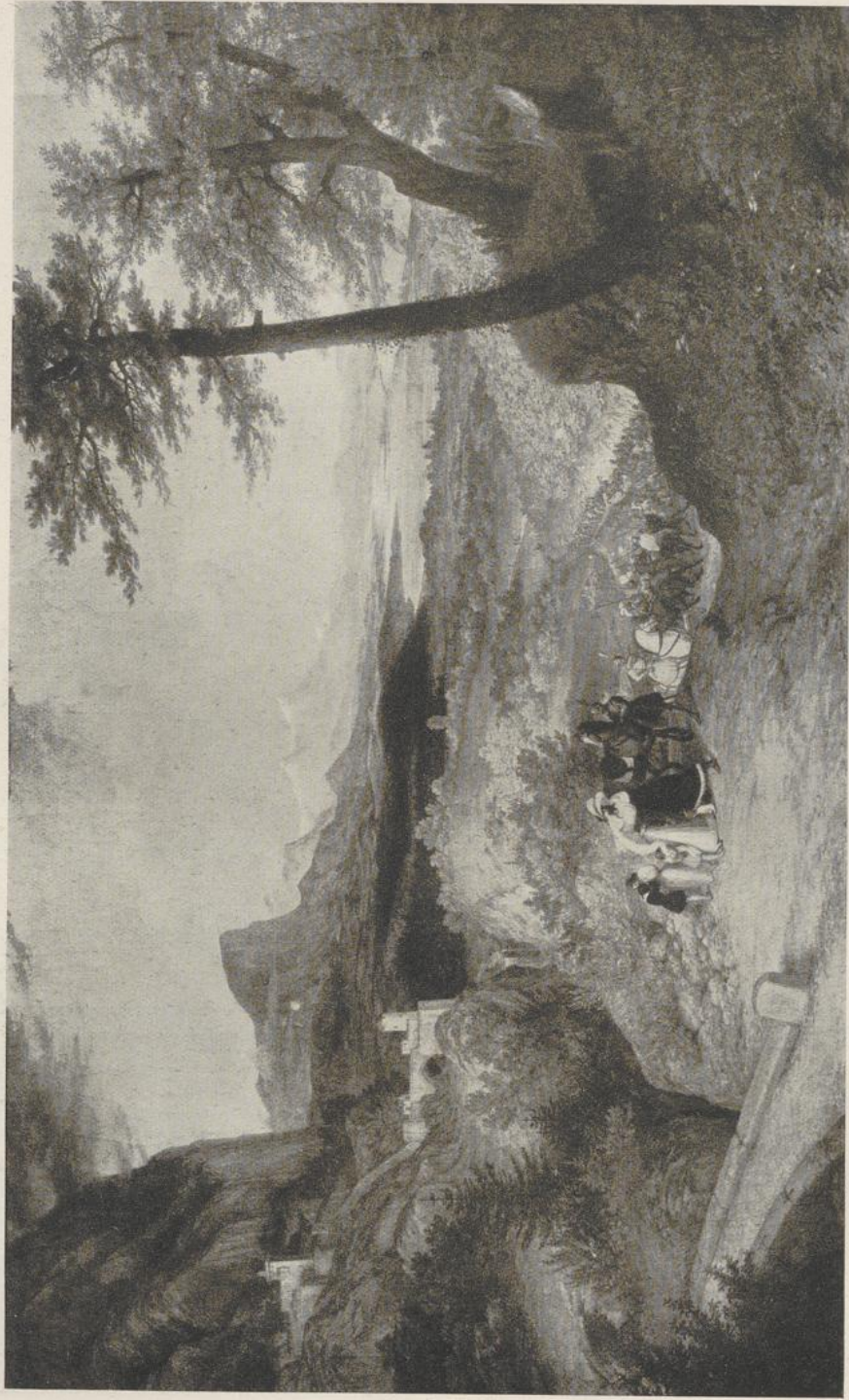
62 Ludwig Ferdinand Schnorr von Carolsfeld, Der Abschied des Herzogs . Wien, Galerie des 19. Jahrhunderts