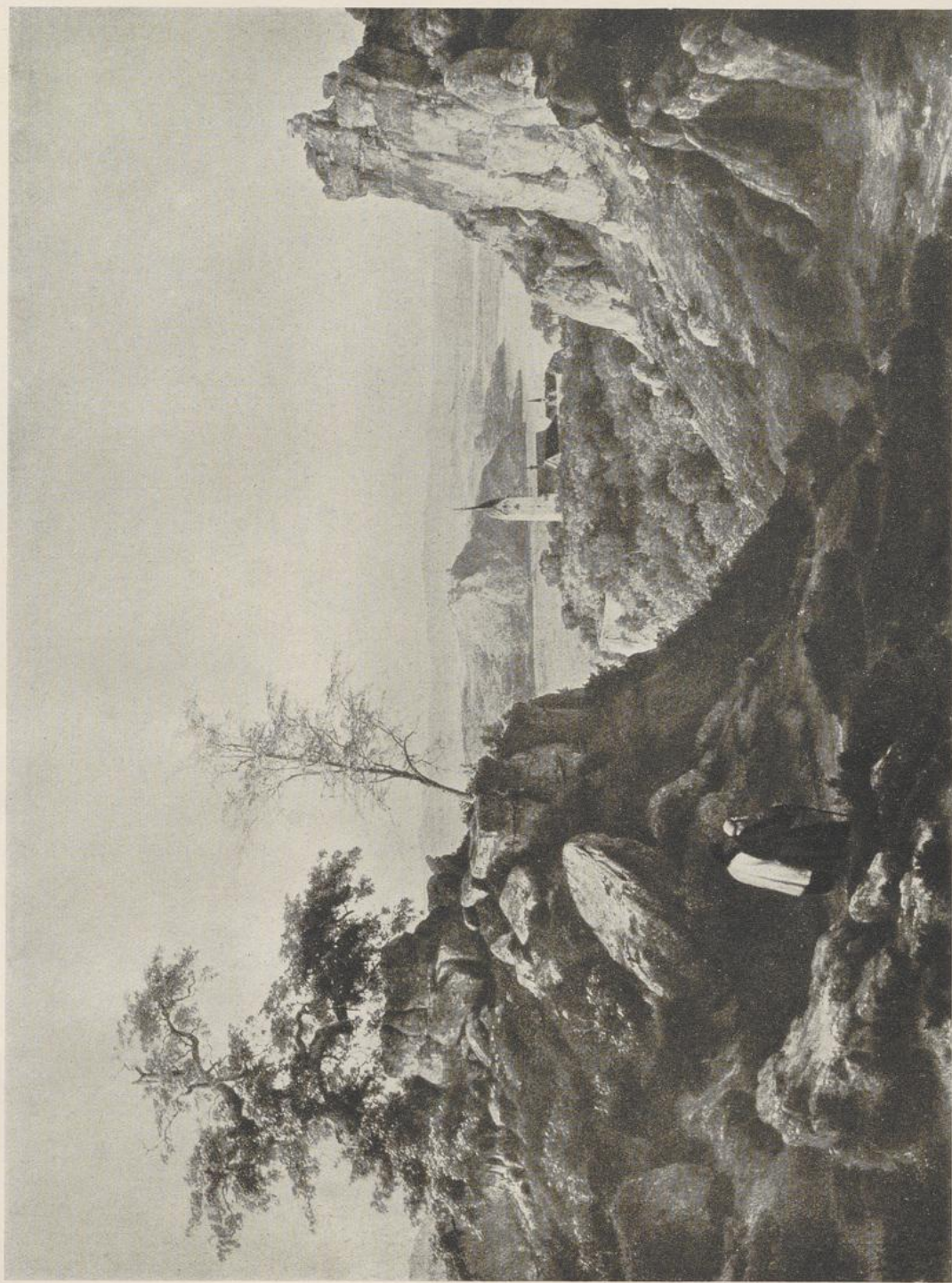
63 Carl Friedrich Lessing, Mosellandschaft. Darmstadt, Hess. Landesmuseum