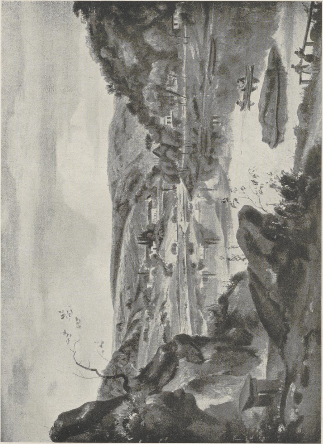
60 Ernst Fries, Stift Neuburg und das Neckartal. Heidelberg, Kurpfälz. Museum