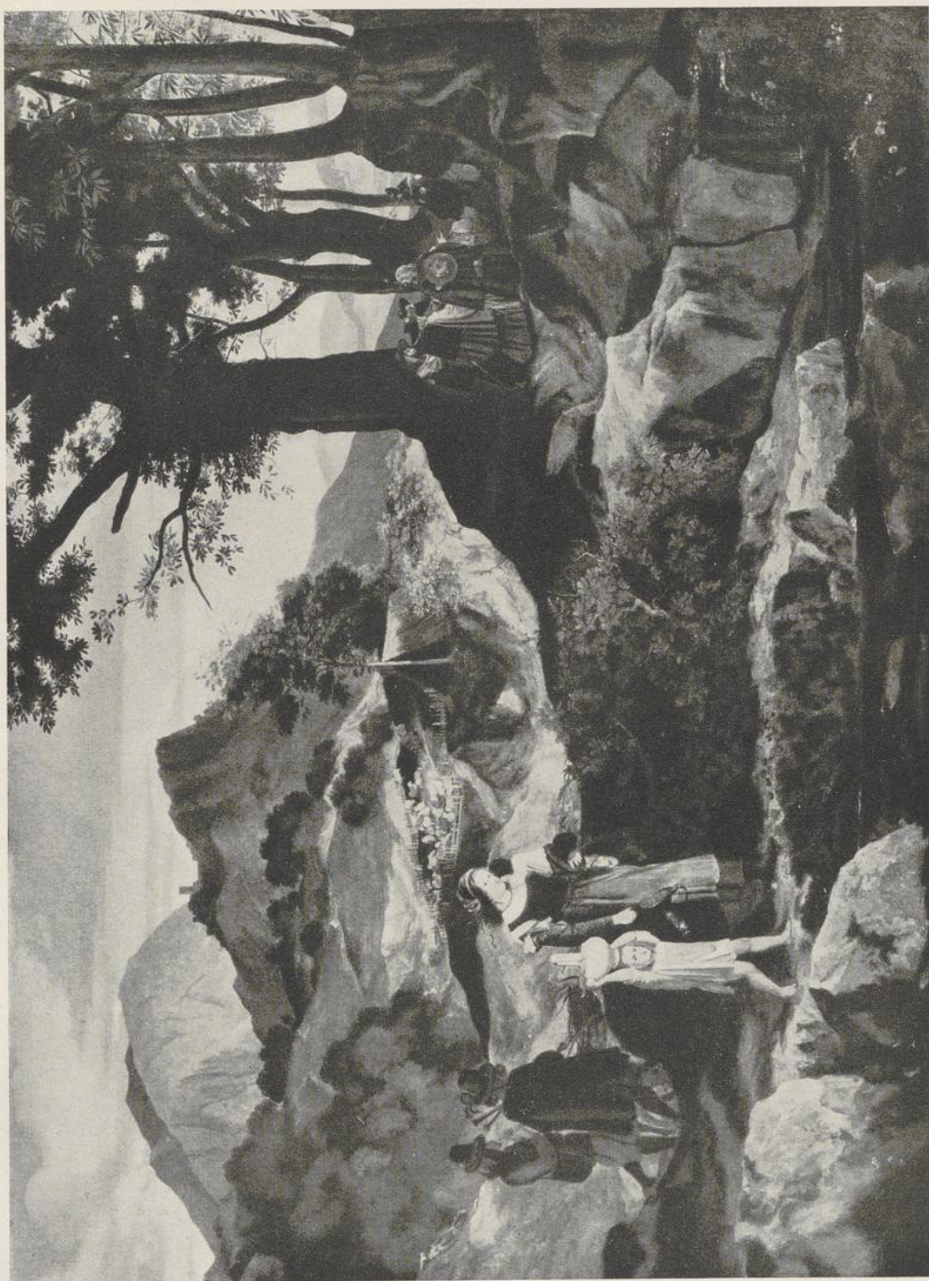
57 Friedrich Nerly, Landschaft bei Olevano . Erfurt, Museum der Stadt