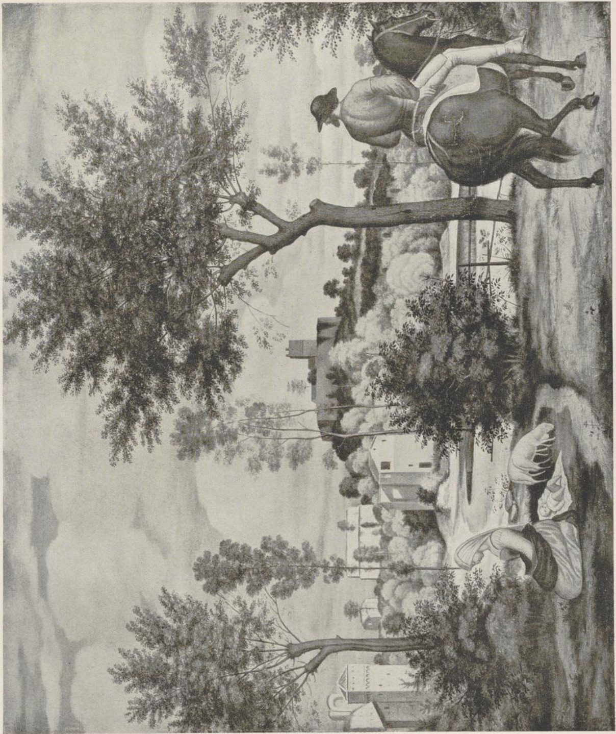
59 Friedrich von Oltvier, Ideallandschaft mit Reiter. Leipzig, Museum der Bildenden Künste