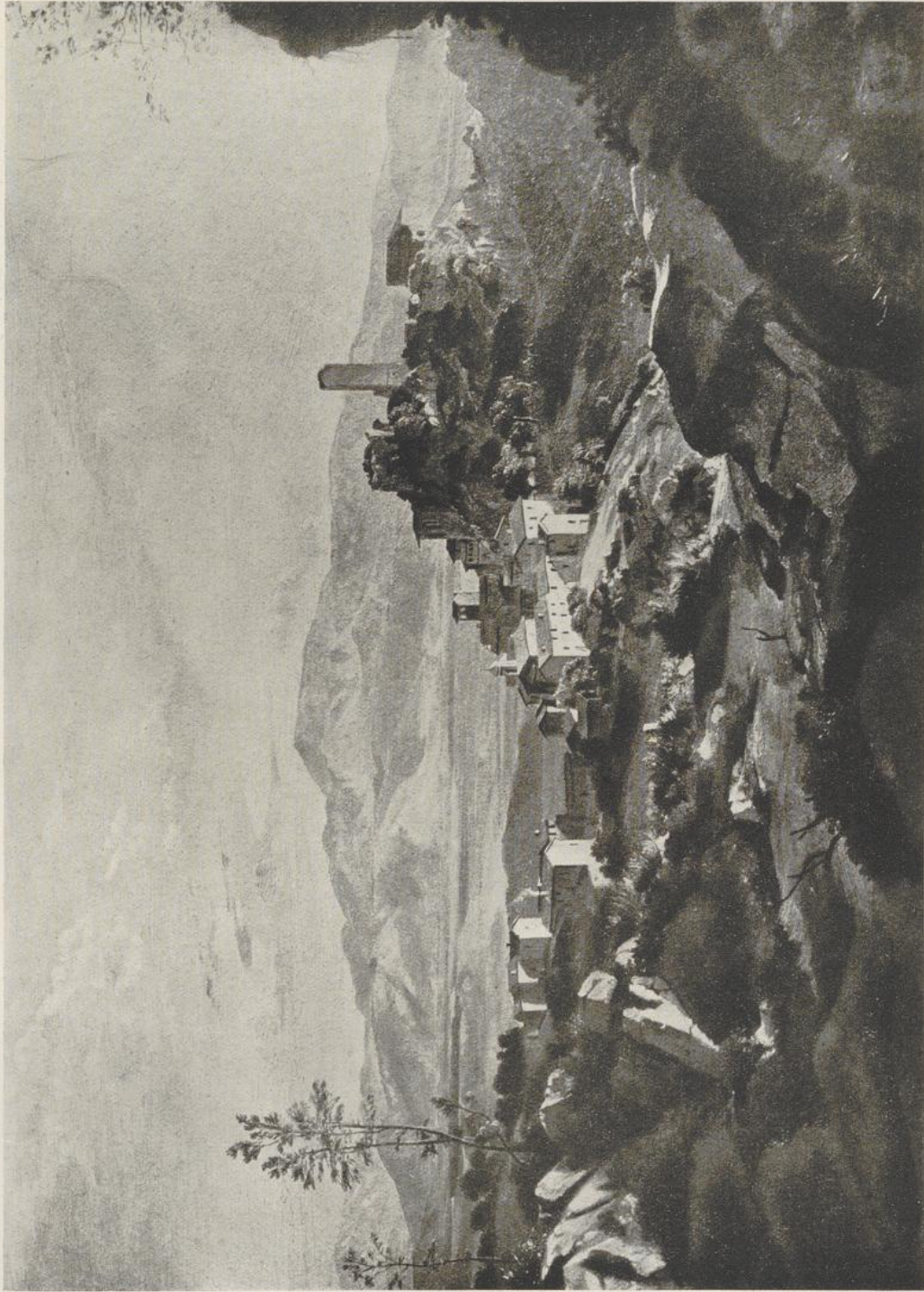
55 Karl Rottmann, Die Akropolis von Sikyon bei Korinth. München, Neue Pinakothek