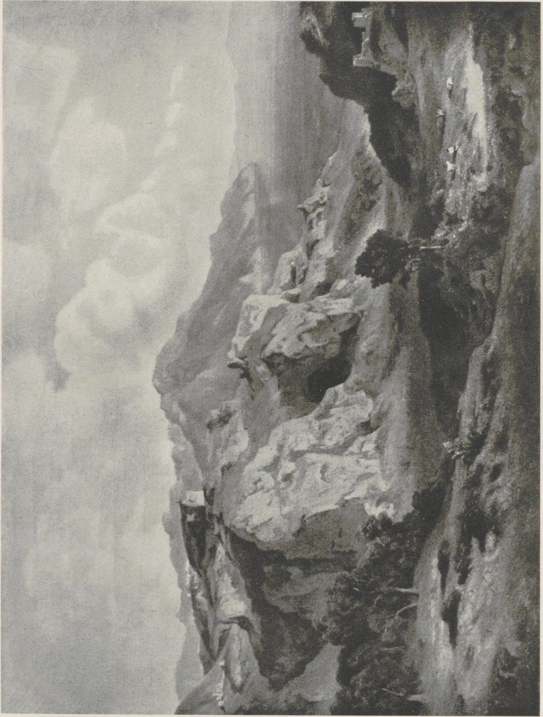
56 Bernhard Fries, Ravello. Verbrannt im Glaspalast Mitten