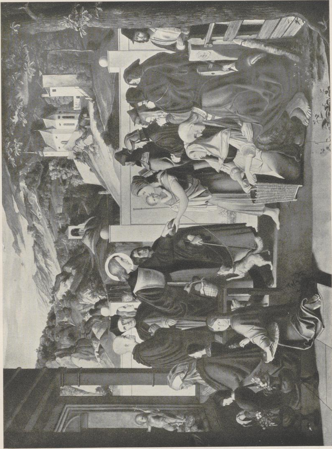
47 Julius Schnorr von Carolsfeld, Der Hl. Rochus Almosen verteilend. 1817. Leipzig, Museum der Bildenden Künste