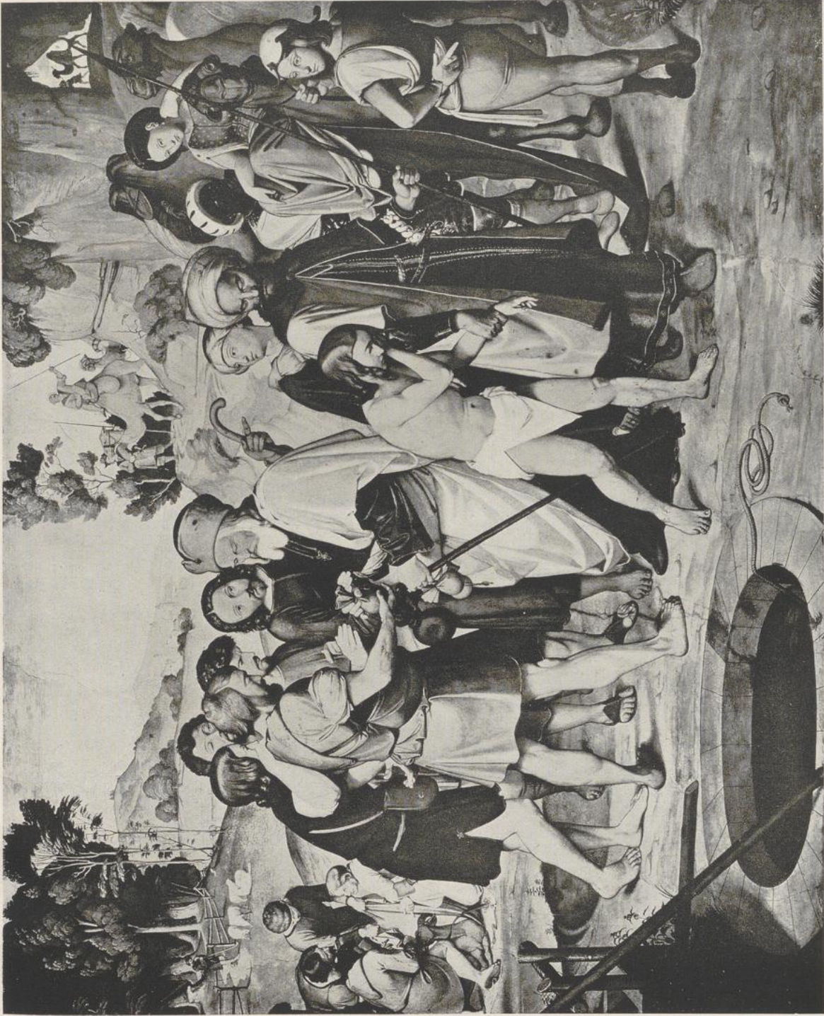
37 Johann Friedrich Overbeck, Verkauf Josephs. 1816. Berlin, Nationalgalerie.