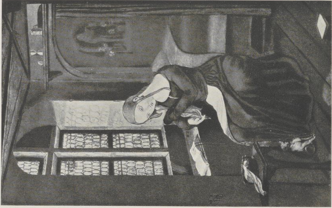
38 Franz Pforri, Allegorie auf Overbecks und Pforrs Schicksal (Sulamith und Maria). 1811. Berlin, Privatbesitz