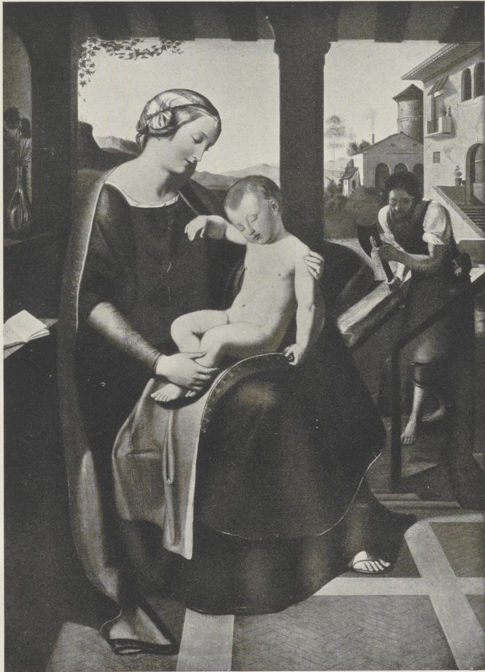
41 Wilhelm von Schadow, Heilige Familie . München, Neue Pinakothek