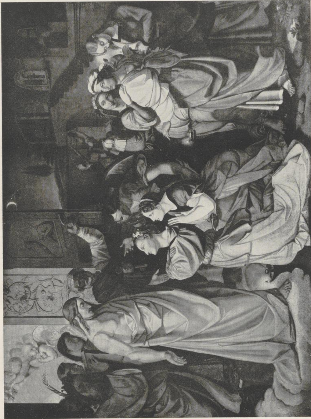
43 Peter von Cornelius, Die klugen und die törichten Jungfrauen (Ausschnitt). Düsseldorf, Städt. Kunstmuseum