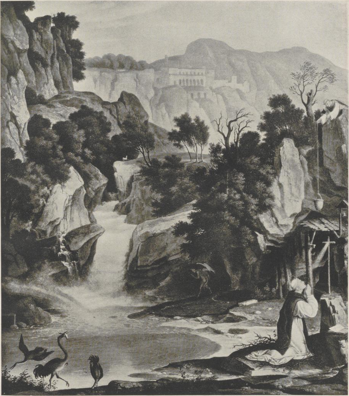
33 Joseph Anton Koch, Landschaft mit dem Hl. Benedikt . Dresden, Staatl. Gemäldegalerie