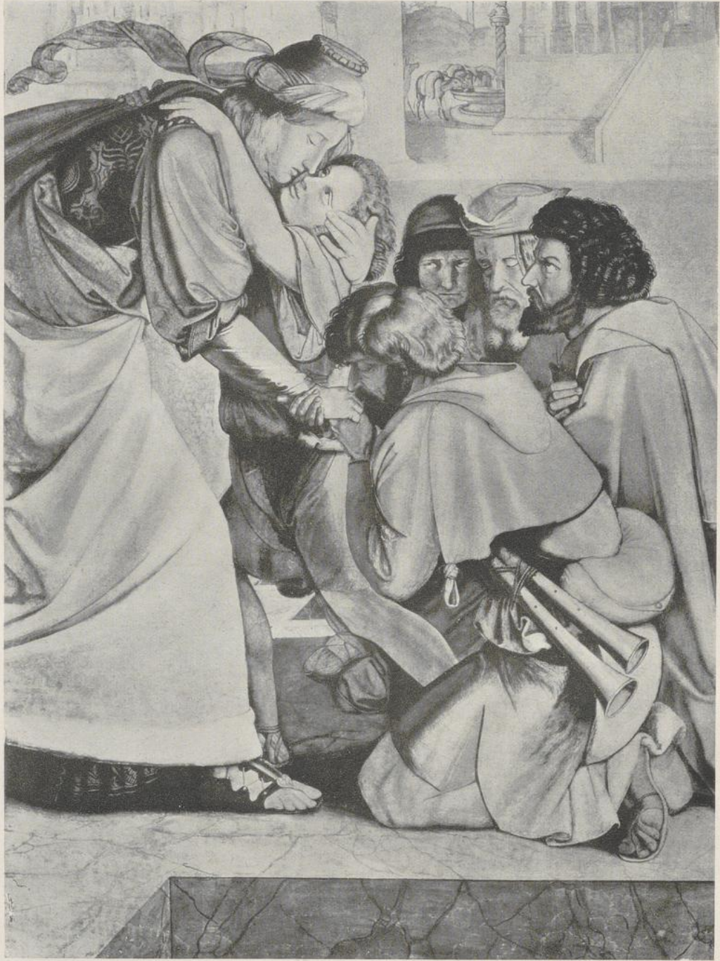
42 Peter von Cornelius, Joseph gibt sich seinen Brüdern zu erkennen (Ausschnitt). 1816—1817. Berlin, Nationalgalerie