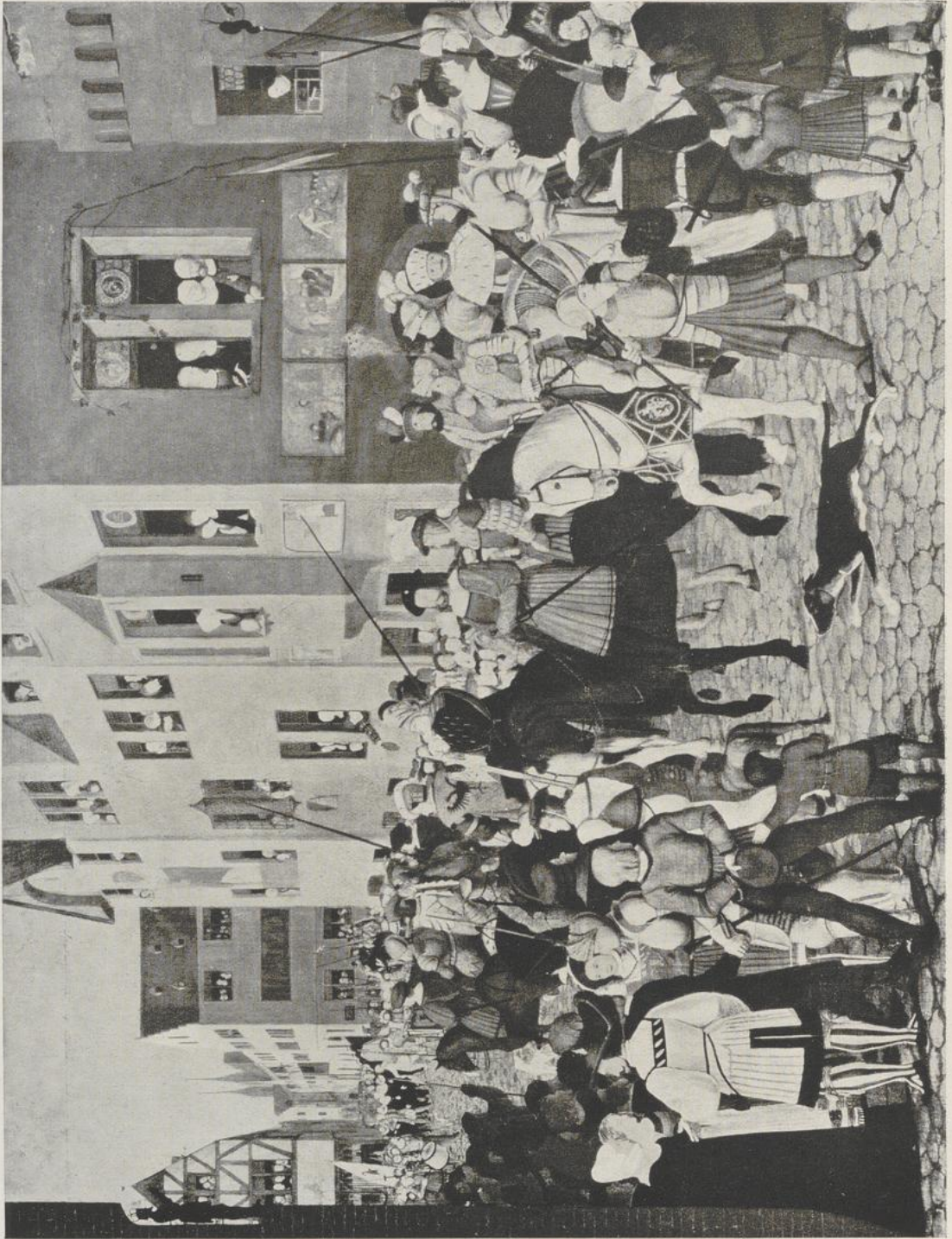
36 Franz Pforr, Einzug des Kaisers Rudolf von Habsburg in Basel im Jahre 1273. 1809 oder 1810. Frankfurt a.M., Städtisches Kunstinstitut