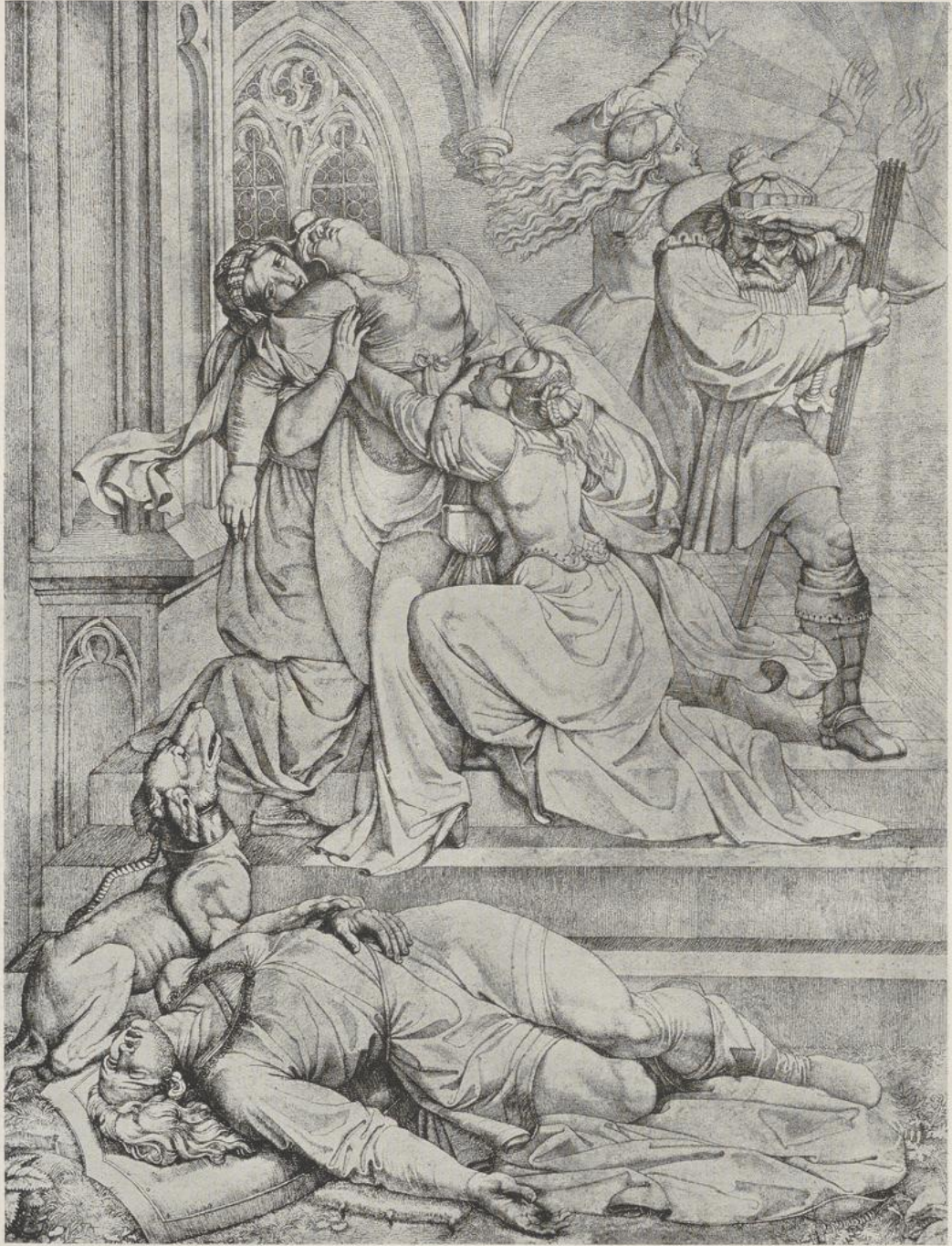
44 Peter von Cornelius, Kriemhild an der Leiche Siegfrieds. Frankfurt a. M., Städelsches Kunstinstitut