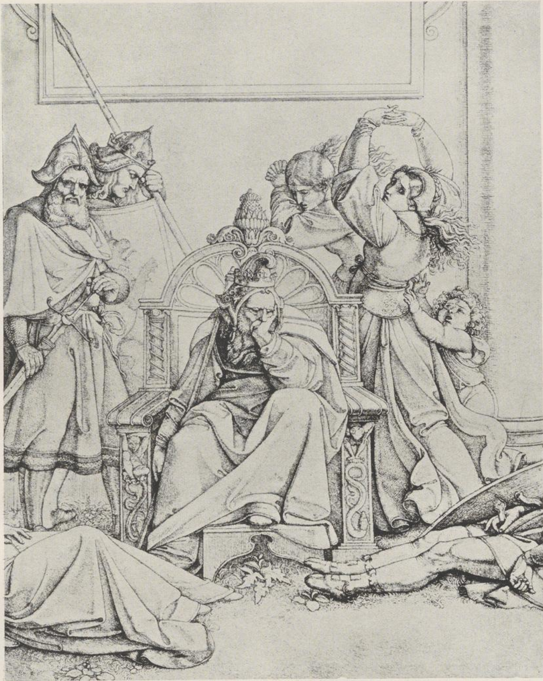
45 Peter von Cornelius, Titelblatt zu den Nibelungen (Ausschnitt). Frankfurt a. M., Städelches Kunstinstitut