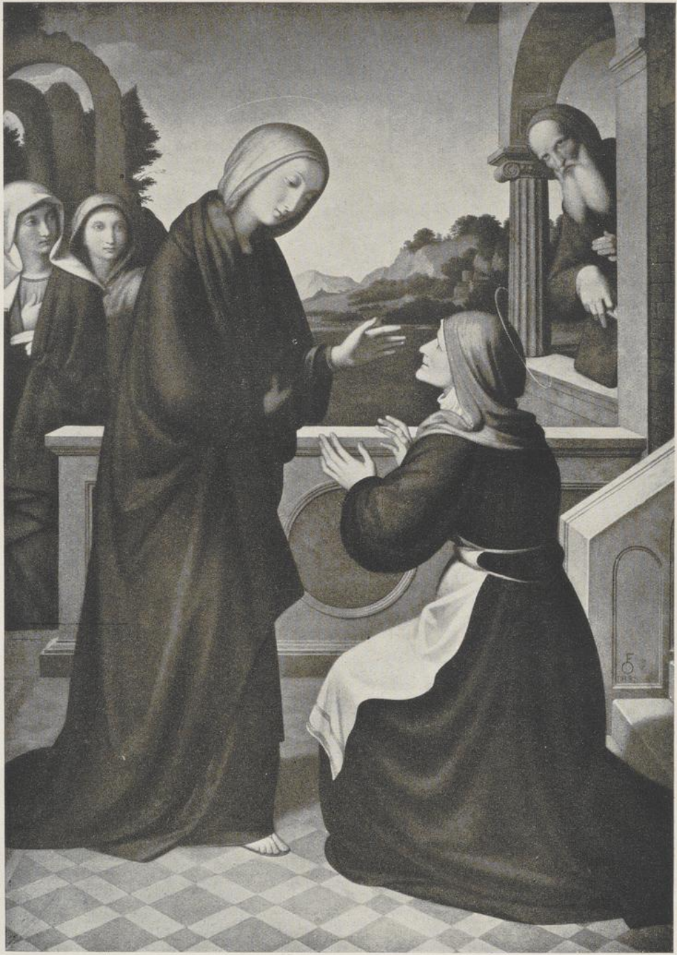
40 Johann Friedrich Overbeck, Heimsuchung der Maria. Karlsruhe, Staatl. Kunsthalle