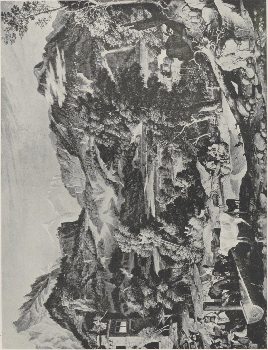
34 Joseph Anton Koch, Berner Oberland. Innsbruck, Tiroler Landesmuseum Ferdinandeum