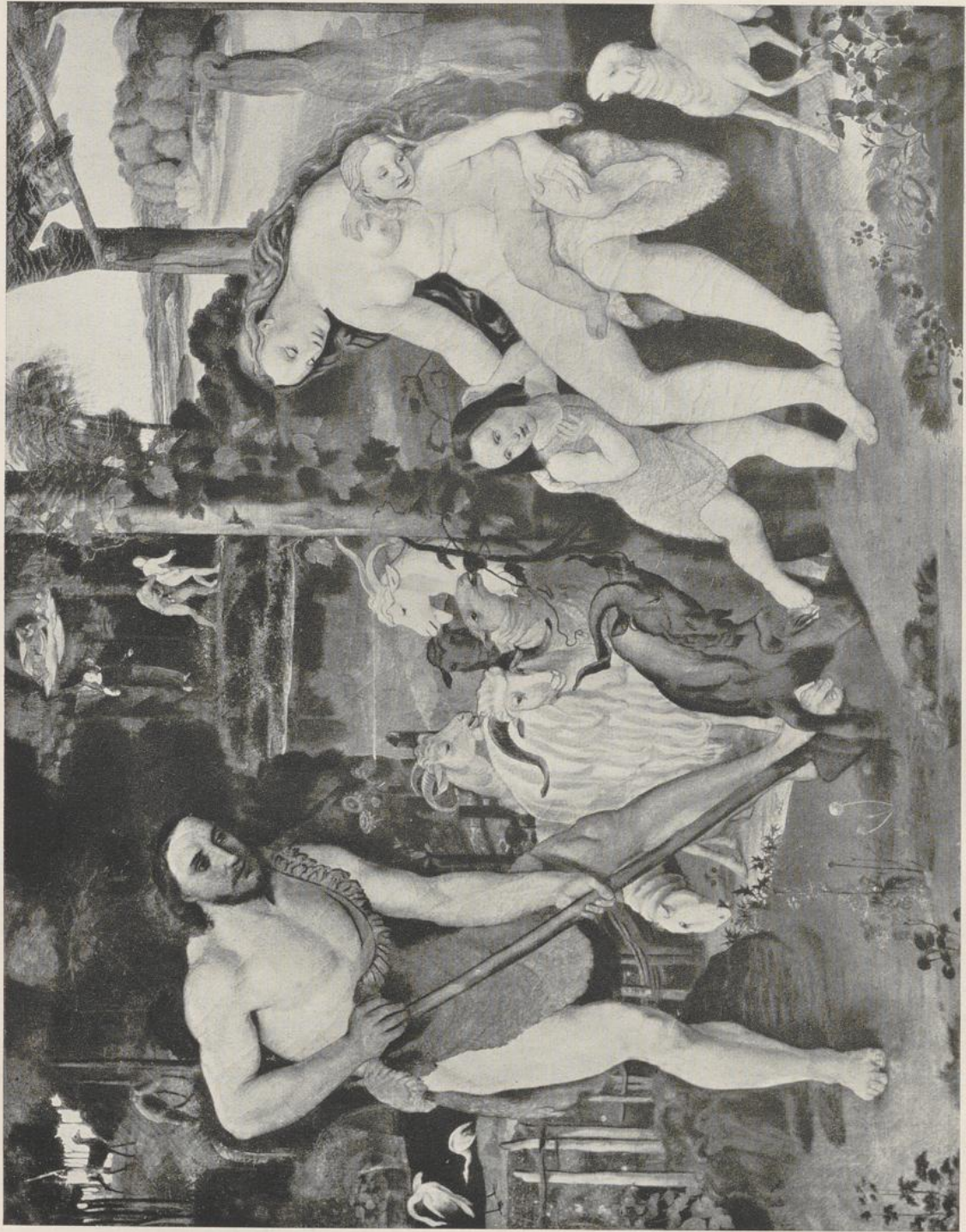
46 Johann Anton Ramboux, Adam und Eva nach der Vertreibung aus dem Paradies. 1818. Köln, Wallraf-Richartz-Museum