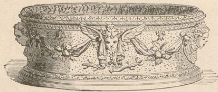
234] Fayence-Gefäß von Bernhard Palissy.