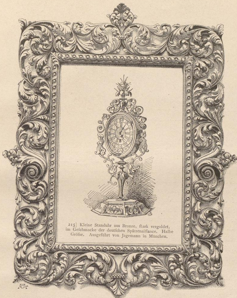
215] Kleine Standuhr aus Bronze, stark vergoldet, im Geschmacke der deutschen Spätrenaissance. Halbe GröÙe. Ausgeführt von Jagemann in München.