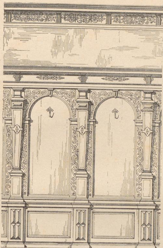
208] Wandvertäfelung im Spiesshof zu Basel, nach W. Bubeck in Seemann's deutscher Renaissance.

Unten Holz, — oben Gewebe, Stein od. Kalk.