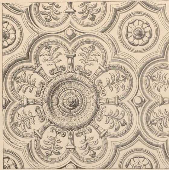
197] Venezianische Decke.