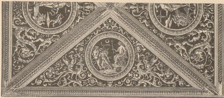
198] Deckenmalerei aus dem Cambio zu Perugia.