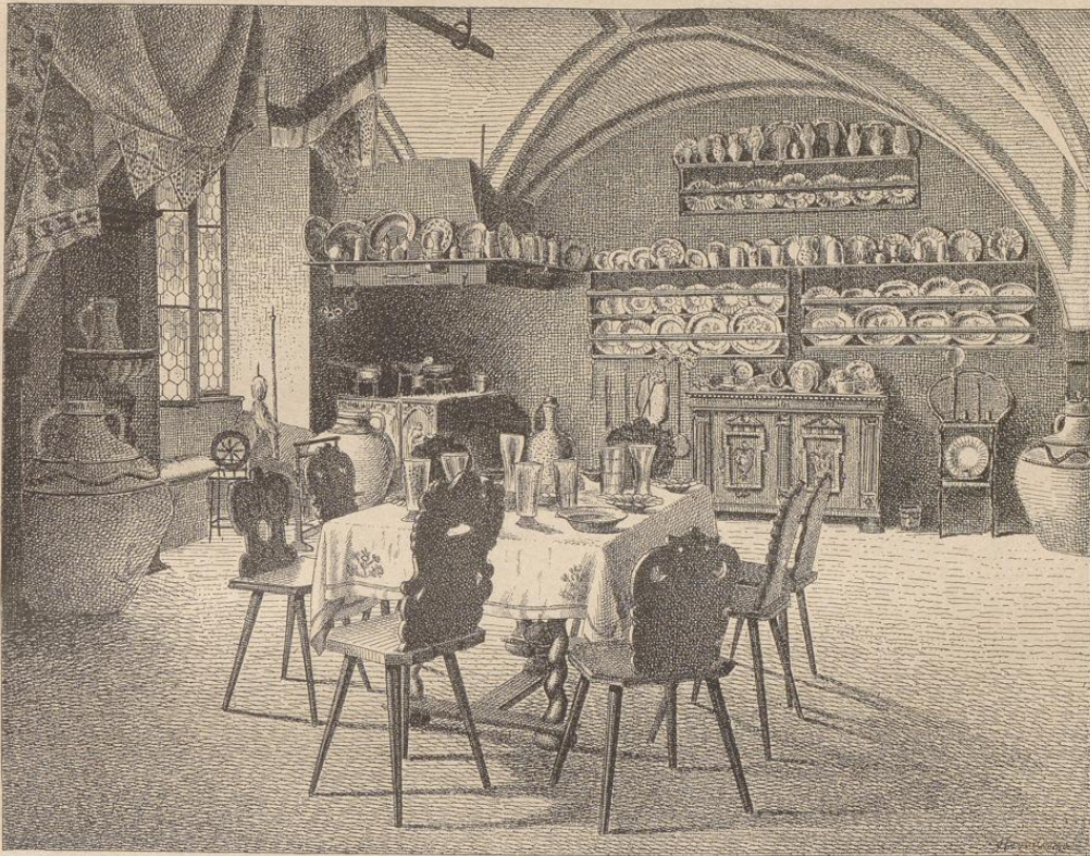
151] Küche im Mufeum zu Salzburg. Gefstellt von Herrn Direktor Schiffmann.

erlaubt sich ähnliche Uebergriffe in fremde Gebiete, um ihren Markt zu erweitern, und wenn auch bei diesen Versuchen dann und wann ein Ergebnis von bleibendem Werthe erzielt wird, so ist doch der Schaden, welchen dieses planlose Experimentiren verursacht, überwiegend. Alles in Allem: Das große Publikum würde für eine lebhaftere häusliche Kunstpflege viel leichter und rascher gewonnen werden, wenn die Künstler und Techniker ihre Aufmerksamkeit mehr auf das anerkannt Nützliche, Einfache und Schöne, als auf das Originelle und Auffallende richten würden.