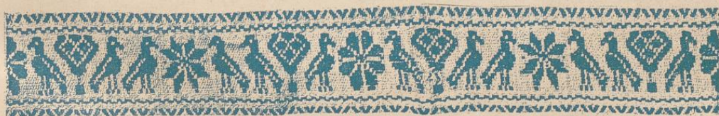
26] Tischtuchborten; deutsche Frührenaissance.

Italiener Alberti schon 50 Jahre vor Raffael aussprach: »Die Schönheit liege in einer solchen Harmonie aller Theile, die bei jedem Hinzufügen oder Weglassen verlieren würde.«