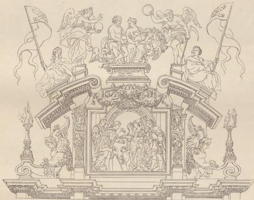
Fig. 140. Rubens. Triumphbogen (n. van Ysendyck).

welche vorzüglich geeignet ist, eine Uebersicht der dekorativen Erfindungskraft des grossen Meisters zu geben. Eine Originalskizze zu der Triumphbogenkomposition des Rubens für den Prinz-Cardinal Ferdinand, nach dem Siege von Callao (1638) entworfen, befindet sich im Museum zu Antwerpen. Die Architektur ist hier, wie immer bei Rubens, im borrominesken Stile gehalten. Eine grosse rundbogige Mittelöffnung mit zwei kleineren Nebenpforten ist reich mit allen möglichen allegorischen Figuren geschmückt (Qu. van Ysendyck). — Die Hofdekoration im malerischen Barock in dem Hôtel, welches Rubens