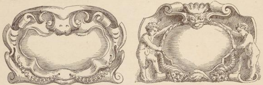
Fig. 141. Franquart. Cartouschen (n. van Ysendyck).

immer in Amsterdam gearbeitet und zählt deshalb zu den holländischen Meistern. Seine Arabesken sind im echten Barockstil, etwas schwer in der Komposition, aber vortrefflich in den Figuren und voll leidenschaftlicher Bewegung, wie es dem Charakter seiner Zeit entspricht. — Ein Meister mit