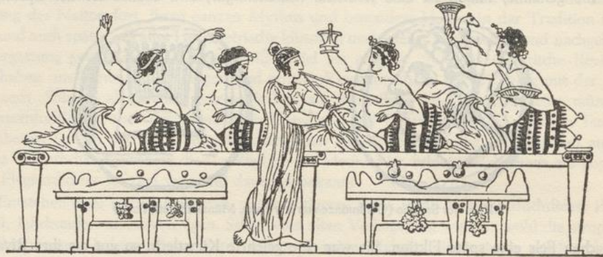
Trinkgelage (Vasengemälde. Antikenkabinett, Wien)

Zur individuellen Lyrik gehört endlich diejenige bestimmte Gattung von Trinkliedern, die von einer musikalischen Freiheit, welche man sich dabei erlaubte, Skolion, d. h. das Krumme, Verbogene, hieß. Man war beim Symposion mit Toasten noch nicht heimgesucht; dafür gab man die Lyra oder einen Myrtenzweig an der Tafel herum und reichte sie denjenigen einzelnen, von welchen ein gutes Lied oder ein Spruch zu erwarten war; wir haben es also mit dem Rundgesang als eigener poetischer