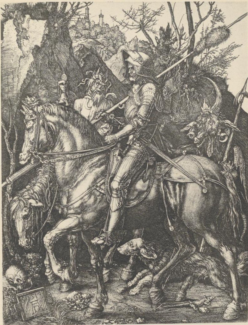
125. RITTER, TOD UND TEUFEL. 1513. Kupferstich.