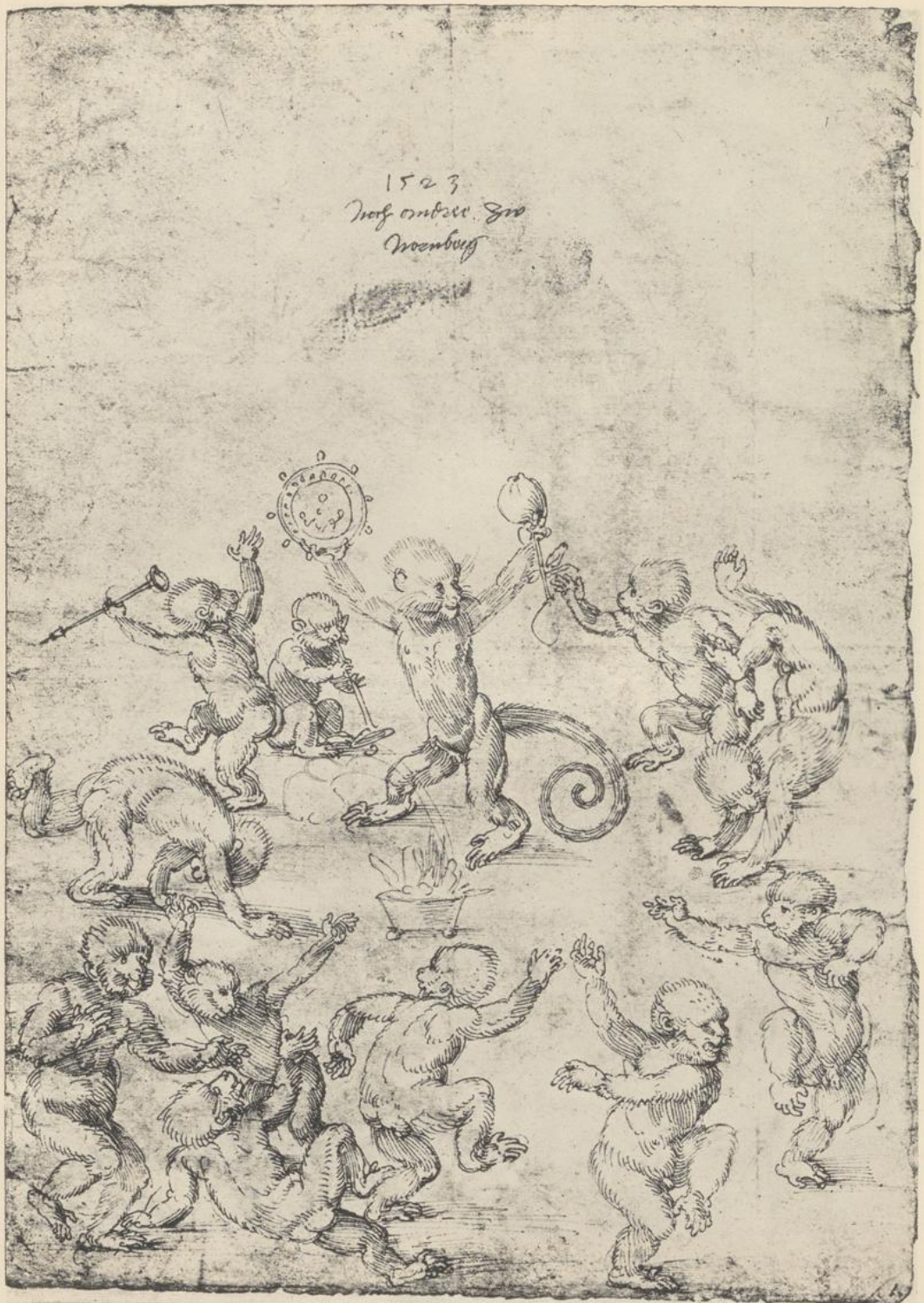
126. AFFENTANZ. 1523. Federzeichnung. Basel, Öffentliche Kunstsammlung.