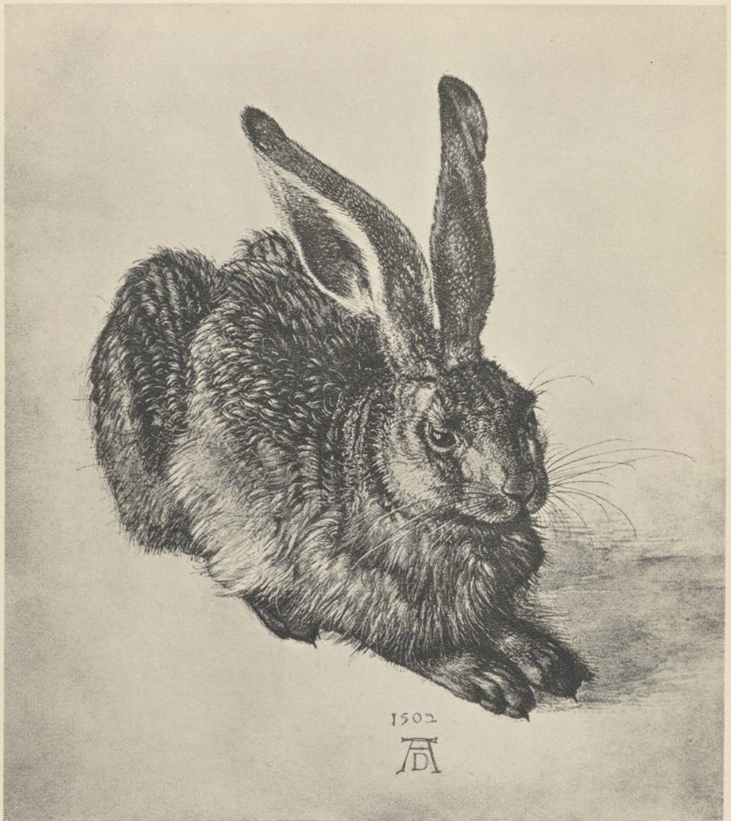
122. JUNGER HASE. 1502. Aquarell. Wien, Albertina.