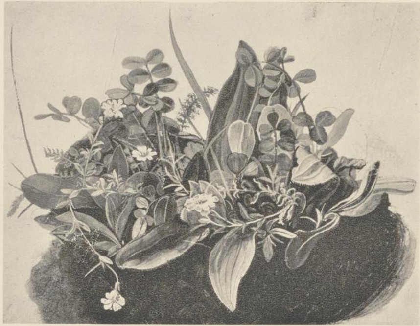
118. DAS KLEINE RASENSTÜCK. Um 1502. Aquarell. Wien, Albertina.