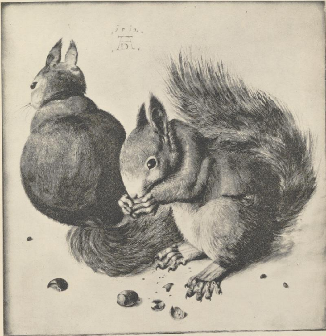
123. EICHHÖRNCHEN (Dürer?). 1512. Deckfarbenmalerei. Bern, Sammlung Ludwig Rosenthal.