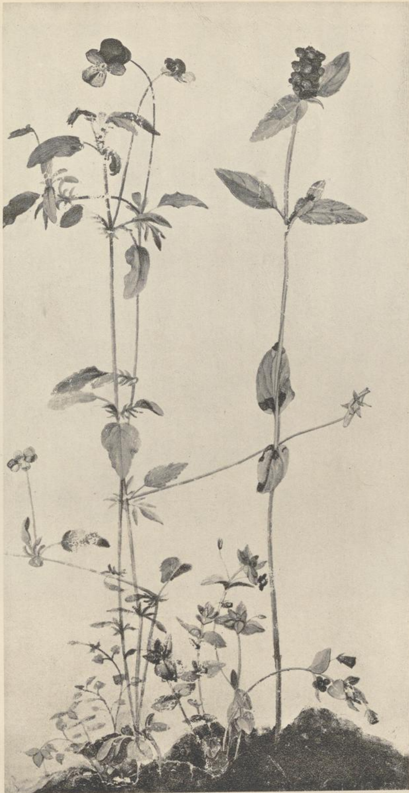
121. PFLANZENSTUDIE (NATTERKOPF). 1496. Federzeichnung, aquarelliert. Wien, Albertina.