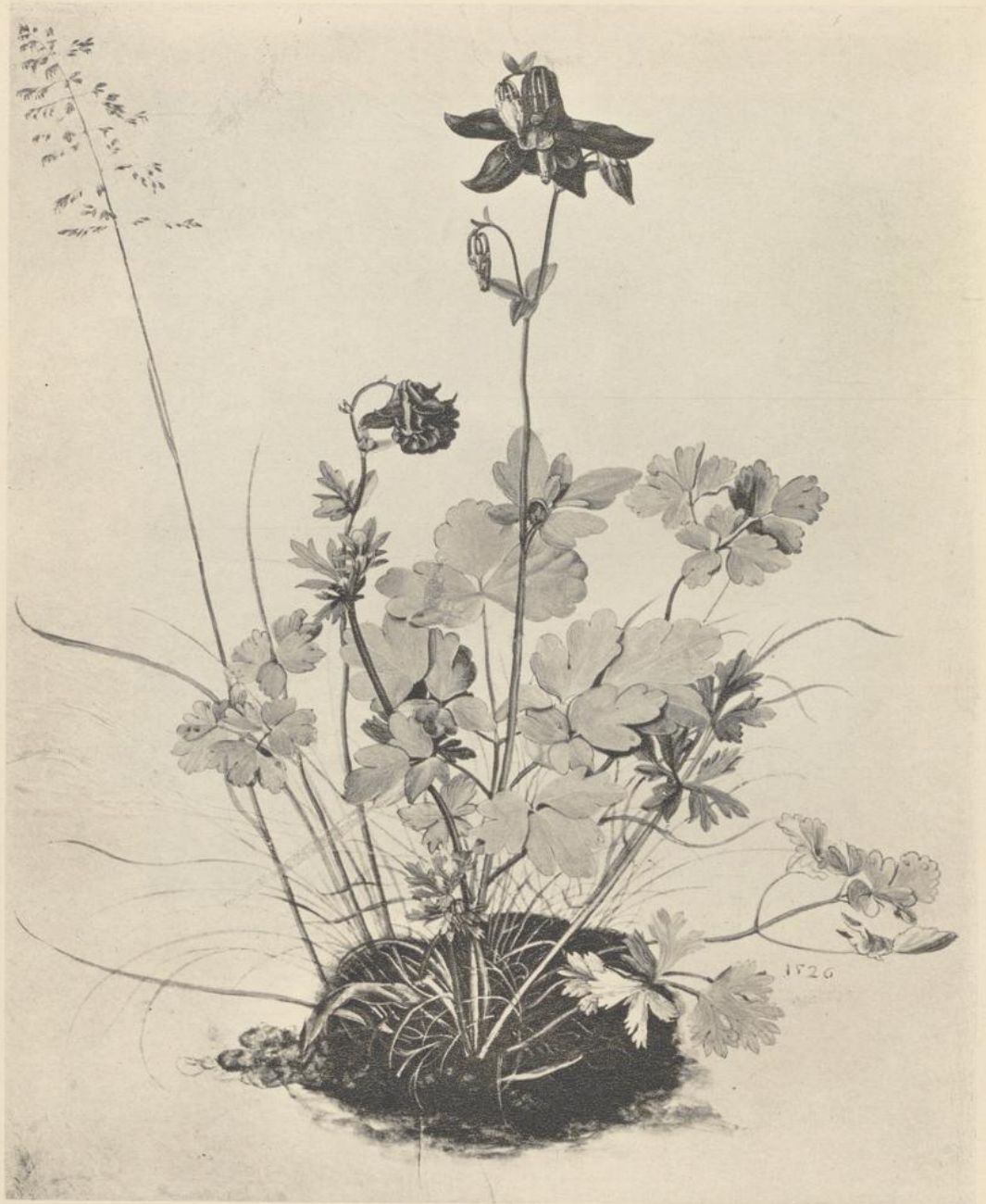
120. AKELEI. Um 1502. Aquarell. Wien, Albertina.