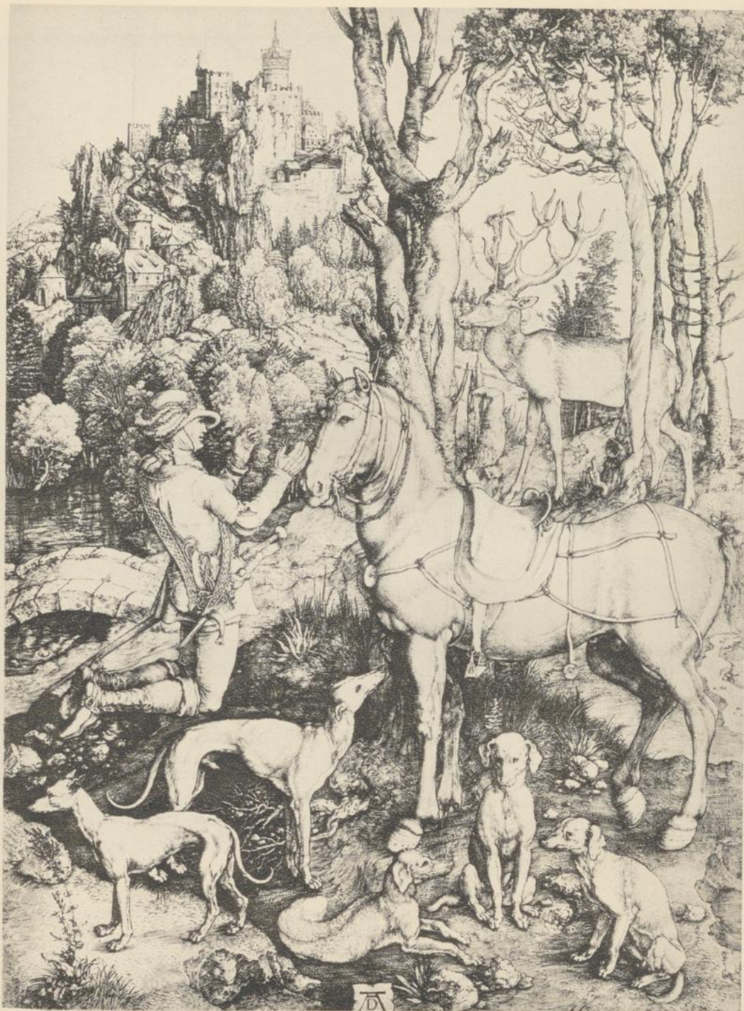
124. DER HEILIGE EUSTACHIUS. Um 1500-1503. Kupferstich.