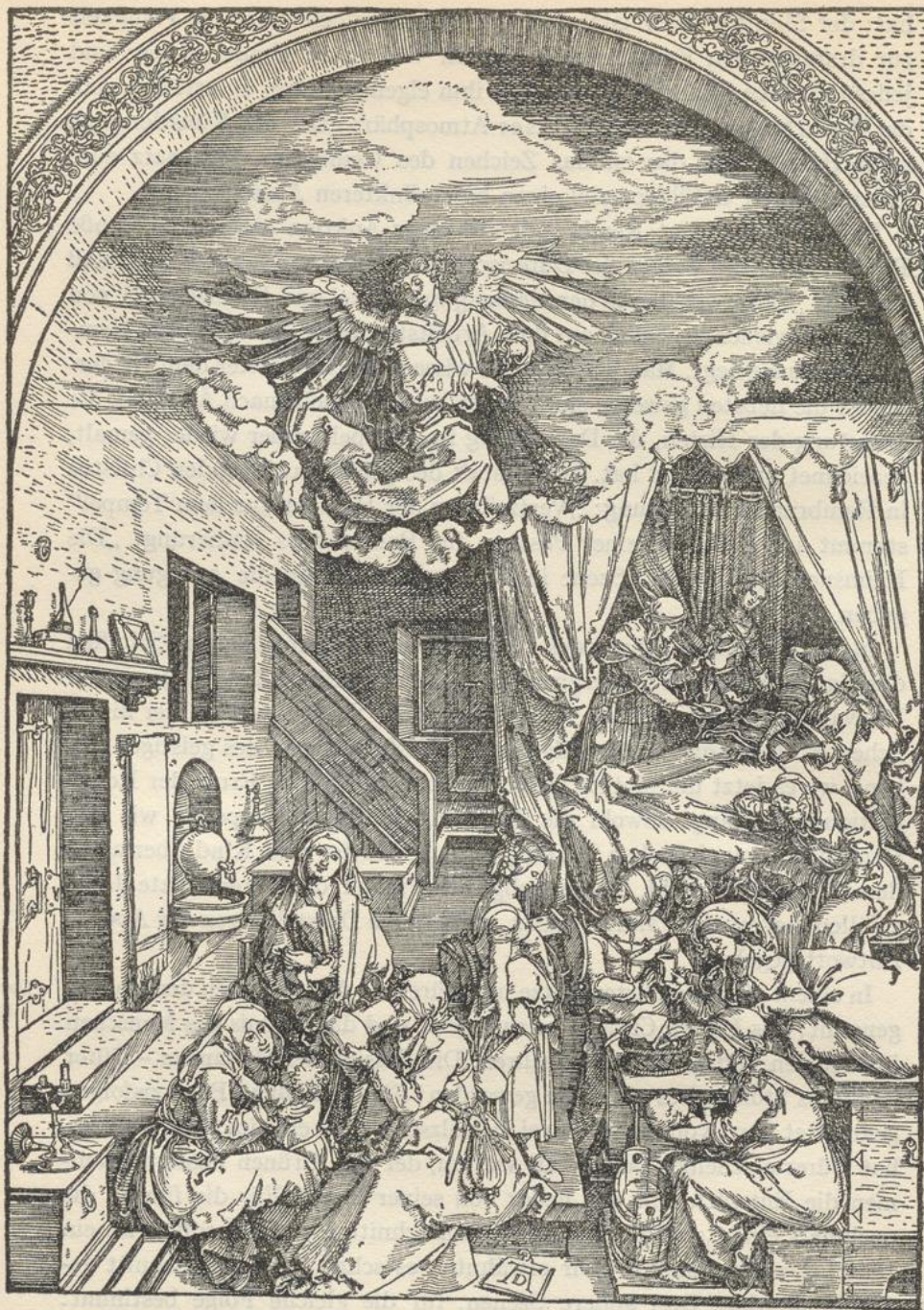
DIE GEBURT DER MARIA. (Marienleben.) Um 1502-1505. Holzschnitt