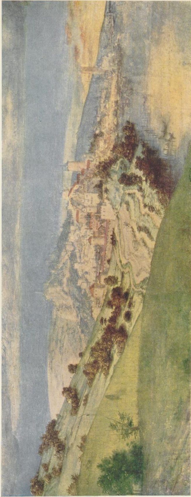
LANDSCHAFT. Ausschnitt aus dem „Allerheiligenbild“ (Tafel 69). 1511. Wien, Kunsthistorisches Museum.