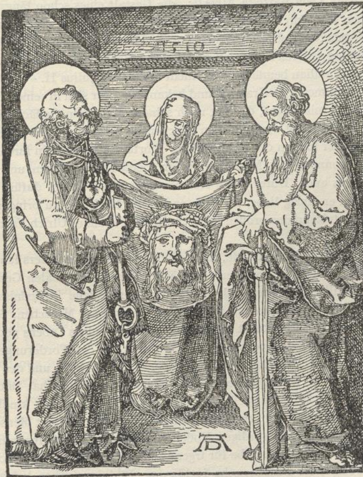
DAS SCHWEISSTUCH DER VERONIKA. (Kleine Passion.) 1510. Holzschnitt

die schmerzliche Süße Leonardos. Dürers Wesen war gleich weit entfernt von der „ terribilità “ des Michelangelo wie von der Ekstasik Grünewalds. Dürer hat nicht – wie es mancher Renaissancekünstler getan hat – die Seele der Form zum Opfer gebracht, er hat aber auch nicht – gleich so manchem Meister der Gotik – die Form gesprengt, um die Seele zu befreien. Dürers Form ist beseelte Form, sie ist weder ein Geschenk vom Himmel, noch gar eine Lehnform aus Italien. Dürers Form ist eine Frucht, mit Sorgen und Kämpfen der nördlichen Erde abgerungen – und nicht ohne Spuren von solcher Mühe.