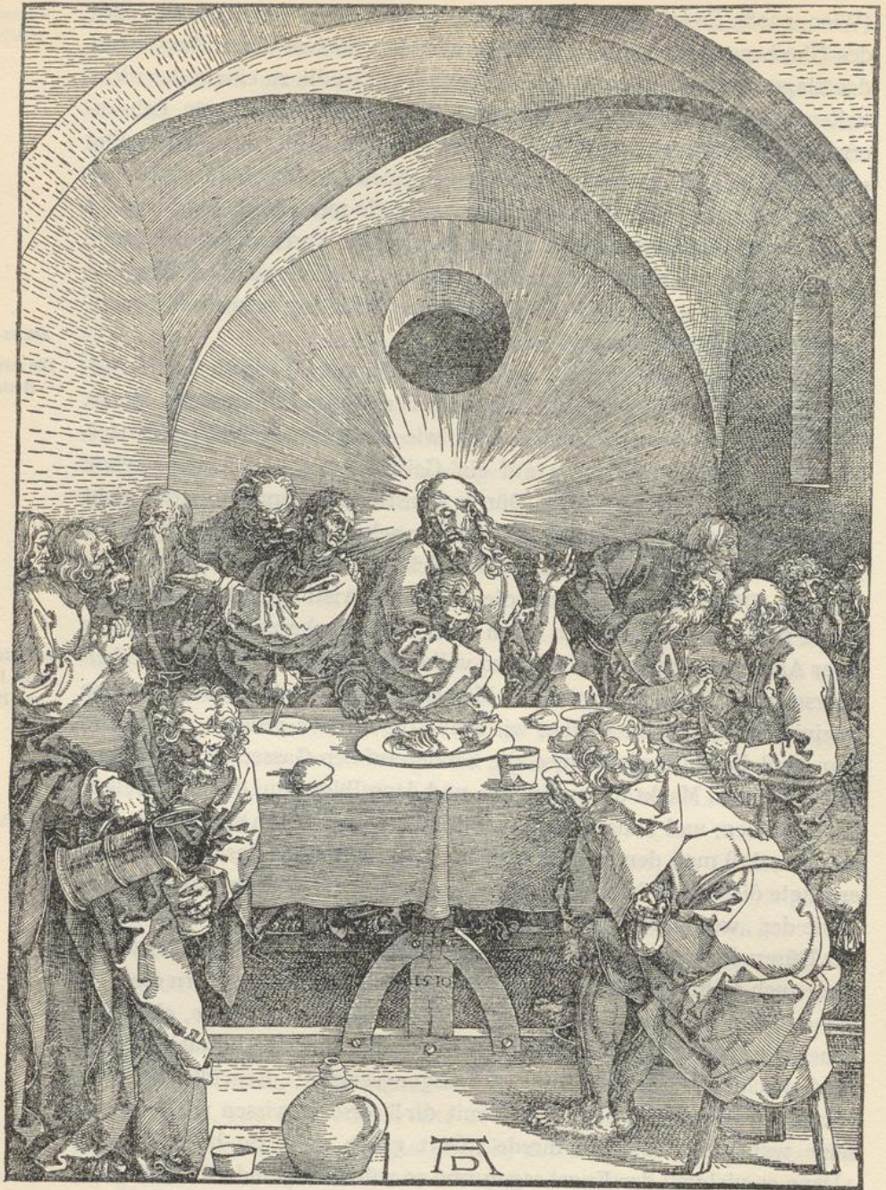
DAS ABENDMAHL. (Große Passion.) 1510. Holzschnitt