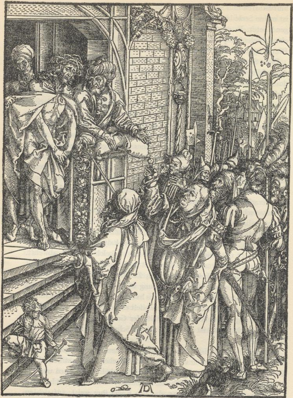
SCHAUSTELLUNG CHRISTI. (Große Passion.) Um 1498. Holzschnitt