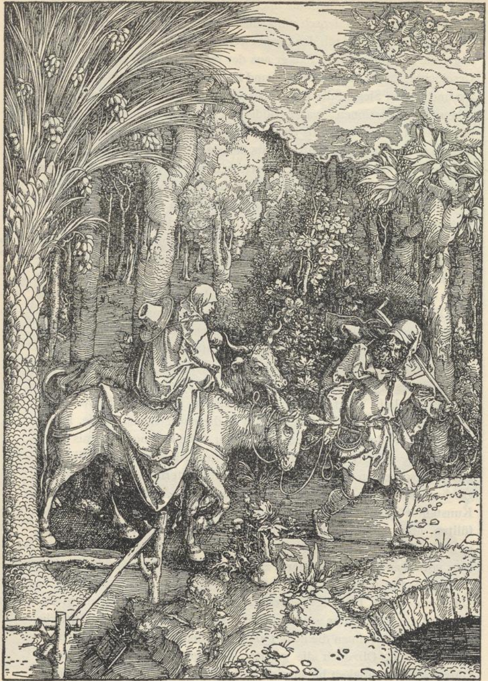
DIE FLUCHT NACH ÄGYPTEN. (Marienleben.) Um 1502–1505. Holzschnitt