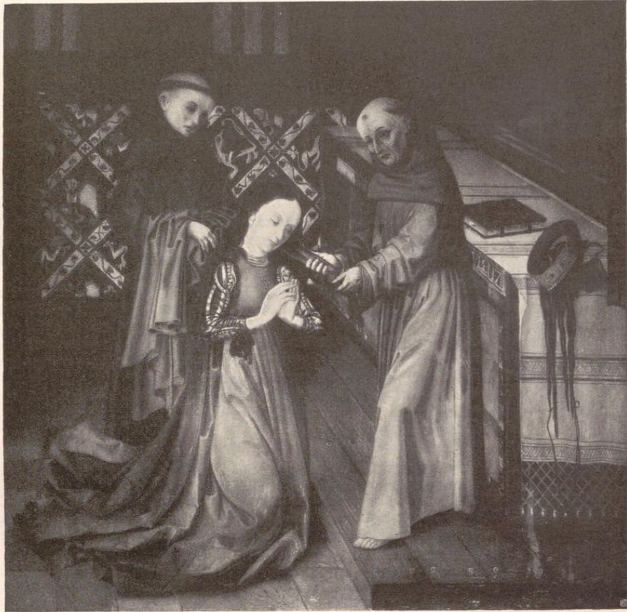
Abb. 35. Einkleidung der heiligen Clara. Bamberg, Gemäldesammlung.

Während jene den Bestellungen der Könige von Frankreich, der Herzöge von Burgund, der Adelligen des Landes ihre Entstehung dankten und bestimmt waren, prunkvolle Säle, luxuriös ausgestattete Schloßräume zu schmücken, dienten diese, die im Auftrage bürgerlicher Besteller angefertigt wurden, neben dem Schmucke der Kirchen und Klöster vor allem der Wohnlichmachung primitiv eingerichteter Räume in Rats- und Bürgerhäusern. 1)