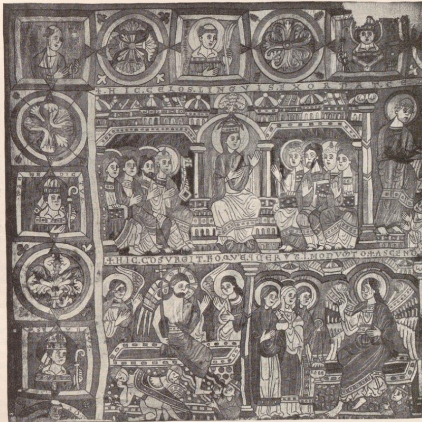
Abb. 28. Stickerei mit Szenen aus dem Neuen Testament. Berlin, Schloß-Museum.

durchmodelliert, die Palette ist viel bunter, die Farbtöne kräftiger; insbesondere erscheinen hier rötliche und rote Nuancen, die auf den anderen Stücken fehlen. Während auf den zwei oberen Streifen jeder Versuch einer Raumangabe, jede Andeutung perspektivischer Tiefenerstreckung, ja sogar die Anbringung jeglichen der Raumvertiefung dienenden Objekts sichtlich vermieden ist, erscheinen auf den Fragmenten IV und V eine Reihe raumvertiefender Akzessorien, die, wie die quer in die Bildebene geschobene verkürzte Säufte, das Faß der Naiade oder die Darstellung von Erdhügeln und Bäumen der Verbindung mit der umgebenden Welt zu dienen bestimmt sind. Auch in der Faltegebung bestehen merkliche Verschiedenheiten; denn die an den Gewandenden hervorschießenden, spitzen Zipfel, die als Präludien des in Sachsen in der ersten Hälfte des XIII. Jahrhunderts heimisch gewordenen, wildbewegten eckigen Stils zu erkennen sind, finden sich ausschließlich auf den Fragmenten IV und V. Doch ist der Stil auch dieser beiden Stücke untereinander nicht homogen. Verschiedenheiten des Kolorits und der Gewandbehandlung lassen auch hier Ungleichmäßigkeiten in der Ausführung erkennen.