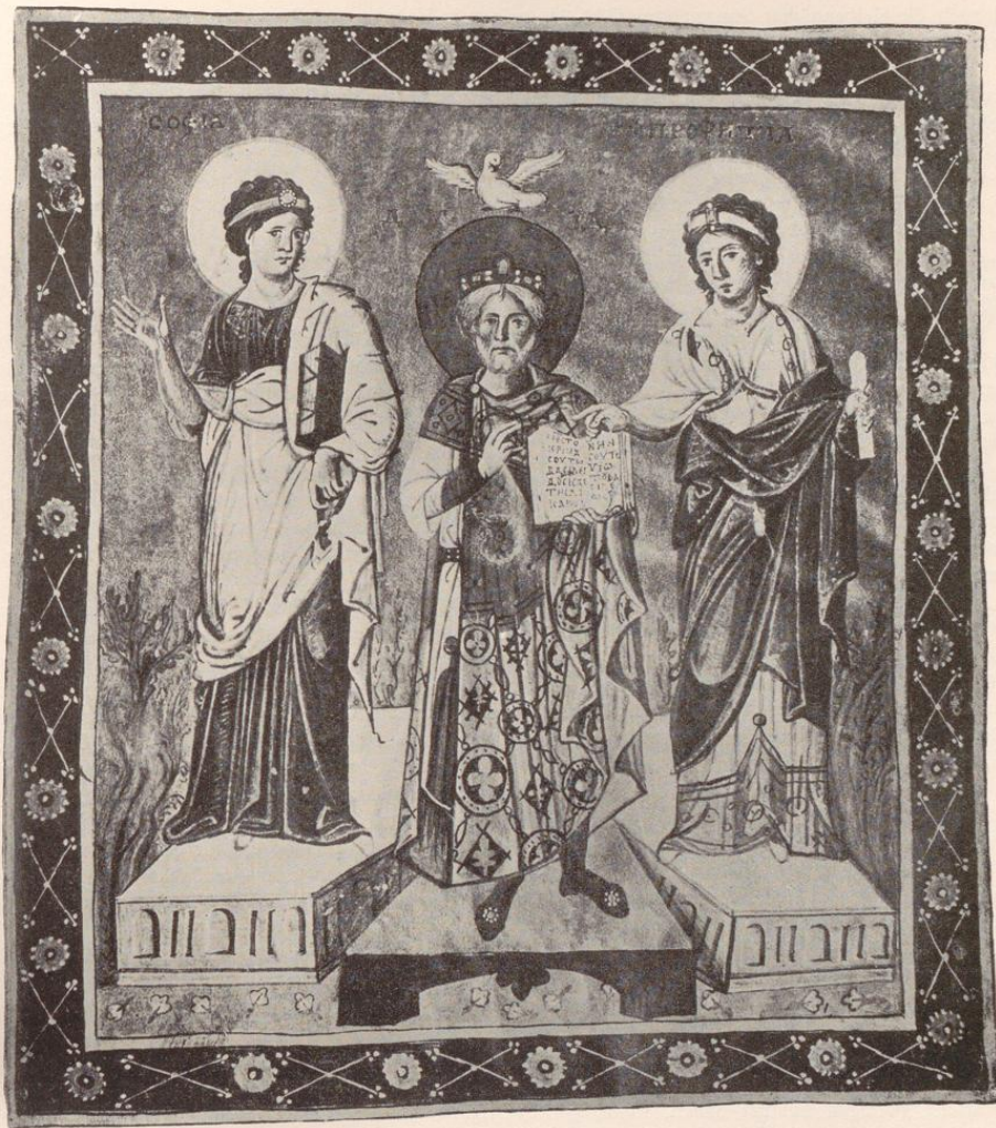
Abb. 34. Miniatur aus dem Pariser Psalter. Paris, Bibliothèque nationale.

abgelauscht sein. Ganz ähnlich bewegte Figuren finden sich im Josua-Rotulus — man vergleiche Josua und die Kundschafter — oder auf dem noch ganz antikisierenden Sarkophag des Junius Bassus. Auch das Motiv des Ver als Hornbläser und der Naiade, die von einer Flußgöttin abstammt, gehen auf antike Überlieferung zurück.