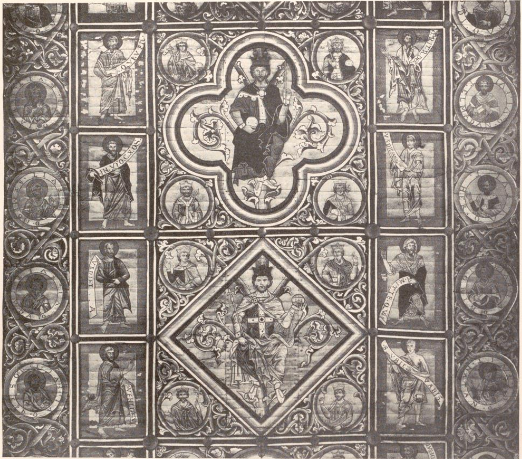
Abb. 27. Deckenmalerei (Ausschnitt). Hildesheim, St. Michaelskirche.

freier und ungezwungener, ein Eindruck, der durch den mehrfach zu beobachtenden Kontrapost — der hier durch Zurückwendung des Kopfes bei vorschreitendem Körper entsteht — erhöht wird, wie bei Castus Amor (Taf. 18/19), bei Mantice (Taf. 15–17) oder Prudentia (Taf. 12). Lebhafter bewegt als die Haltung der Figuren ist der Falten-schwung der Gewänder. Windgebauchte Ärmel, flatternde Zipfel, sich wellende Säume, unruhige Zickzackränder bestimmen den Eindruck der Gewandumrisse. Bemerkenswert ist der Reichtum der Zierborten und des Schmucks. Die Köpfe sind fast durchwegs stark idealisiert und entbehren eines individuellen Ausdrucks. Nur die bärtigen Greise, wie Martianus zum Beispiel (Taf. 15–17), zeigen naturalistisch durchgebildete Züge.