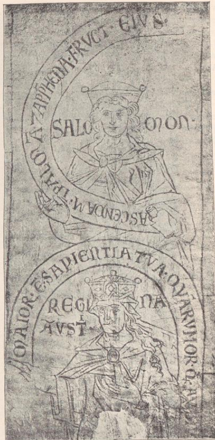
Abb. 30. Salomon und die Königin von Saba (Synagoge). Pause nach einem Wandgemälde. Halberstadt, Liebfrauenkirche.