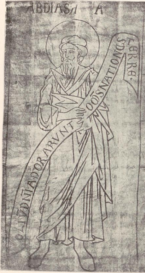
Abb. 29. Prophet Abdias mit Spruchband. Pause nach einem Wandgemälde. Halberstadt, Liebfrauenkirche.

Vorstellung von der Wirkung des einstigen, nur mehr in Resten erhaltenen Rahmens des Quedlinburger Teppichs zu geben vermag. Die Form der antikisierenden Akanthusranken selbst kehrt, wenn auch in einer durch die Textiltechnik bedingten, etwas schwerfälligeren Umwertung auf der Abschlußbordüre (Taf. 20) des Teppichs wieder. Von den Figuren wären die sitzenden Könige, die Halbfiguren der Tugenden und die antiken Flußgöttern nachgebildeten Paradiesesflüsse — ihnen ähnelt insbesondere die Gestalt der Naiade — mit den Teppichbildern zu vergleichen.