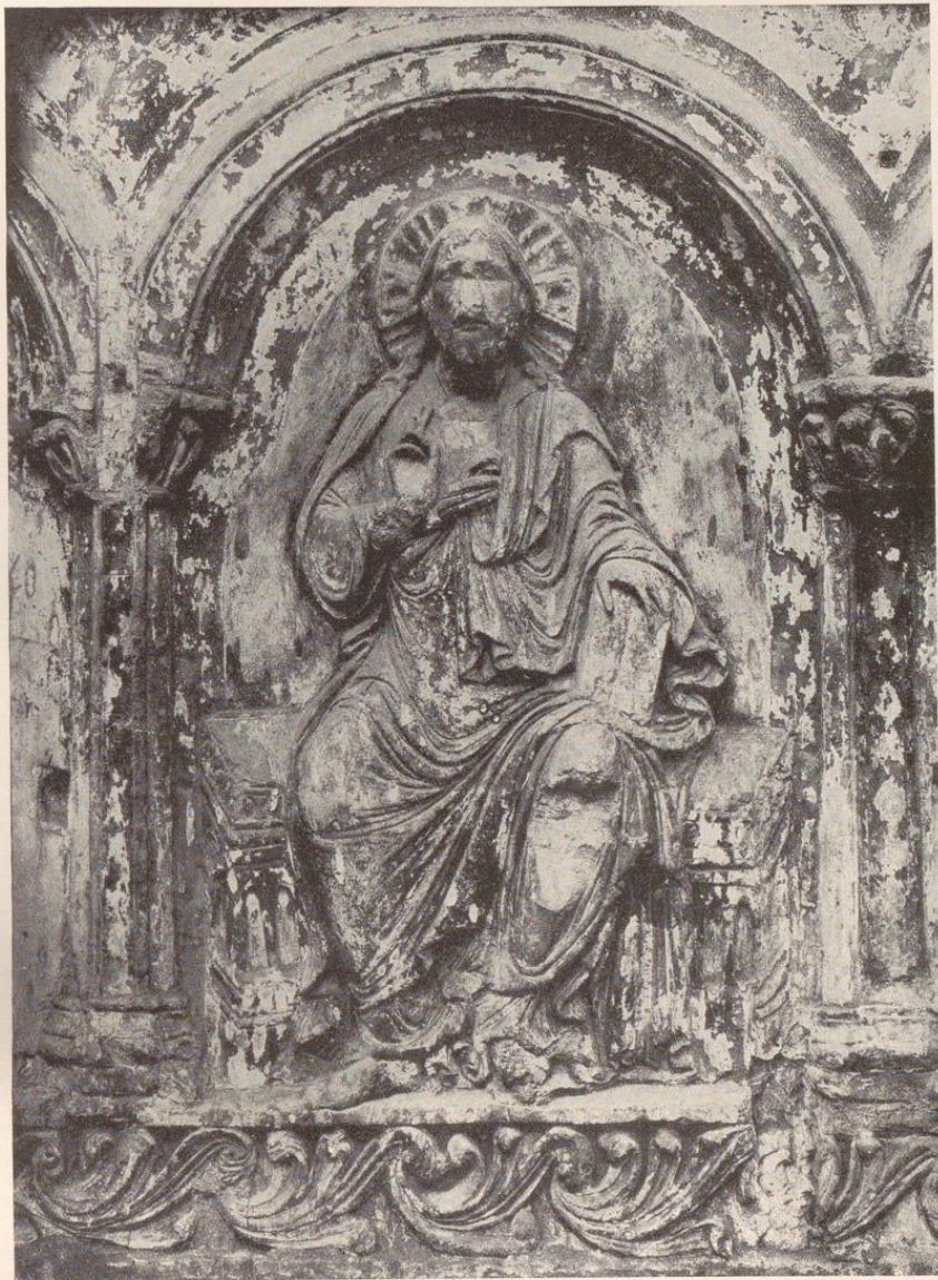
Abb. 32. Stuckrelief mit thronendem Christus. Halberstadt, Liebfrauenkirche. Nördliche Chorschranke.