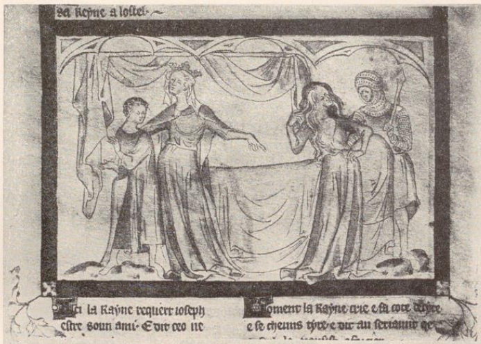
Abb. 33. Miniatur aus dem Queen Mary Psalter. London, Nationalbibliothek.

wändern ähneln in ihrer idealisierten Körperlichkeit römischen Göttinnen auf antiken Bildwerken. Die Ungezwungenheit der Haltung, die Freiheit der