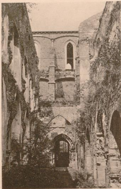
Der Ostkrenzgang. Blick nach Norden.