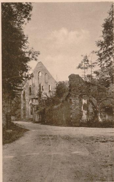
Blick auf die Ruine vom Platze hinter der Mühle.